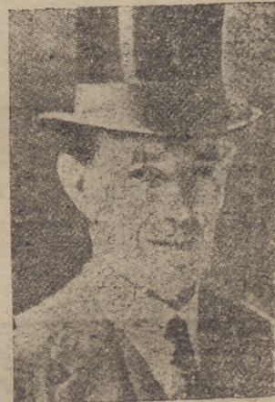
...y lord Halifax, por radio, a todo el pueblo inglés.