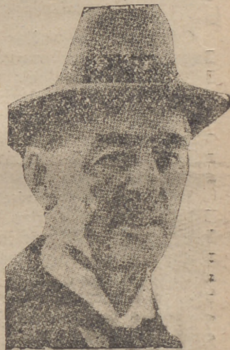
Chamberlain en la Cámara de los Comunes...