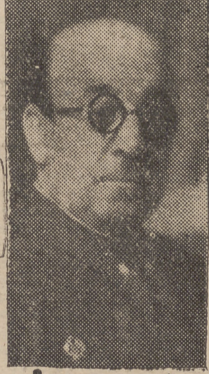
EL GENERAL MOSCARDÓ SALE PARA MADRID