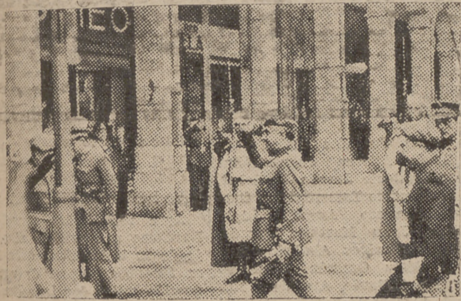
EL CAUDILLO AL LLEGAR AL AYUNTAMIENTO

Reunión del Consejo Nacional de Falange Española Tradicionalista y de las J. O. N. S.