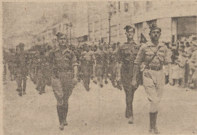
LAS FUERZAS DEL REGIMIENTO DE INFANTERIA OVIEDO NUMERO 8 DESFILAN EN EL DIA DE LA VICTORIA, POR LA CALLE DE LARIOS