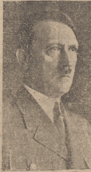
agradecimiento hacia Hitler, por sus palabras de admiración para Inglaterra.

Terminó recomendando a la Prensa que no haga nada que pueda perjudicar a los intereses de Inglaterra.