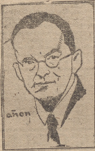
CONRAD HENLEIN nombrado jefe del Poder ejecutivo en Bohemia

Más información en las páginas centrales y octava de los acontecimientos en la Europa Central.