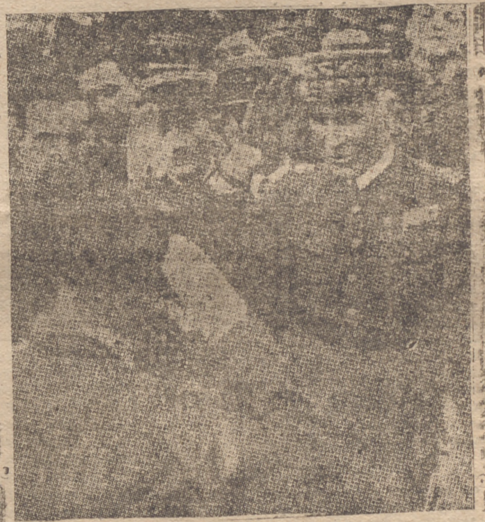
En la línea fronteriza, el general francés Fagalde y el general jefe del Cuerpo de Navarra, Solchaga, se saludan afectuosamente