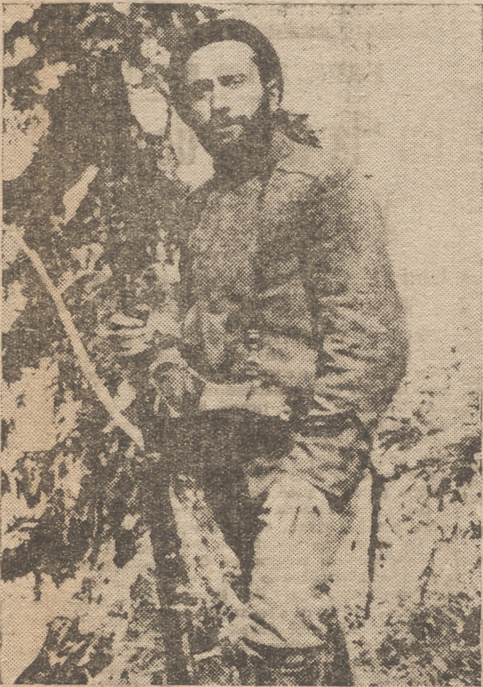
BENITO Mussolini después de su activa campaña de 1914 y 1915 para conseguir la intervención de Italia en la guerra europea, se alista como voluntario en el cuerpo de "bersaglieri" resultando gravemente herido. Será también finalizada la guerra el promotor del resurgimiento y de la grandeza de su país, reuniendo y organizando a los combatientes y "arditi" de la gran guerra en la célebre reunión de 23 de Marzo de 1919

lia. Y ante su fórmula engañadora: "Dentro de poco haremos la revolución", los comunistas interrumpían: "¿Por qué no enseguida?"