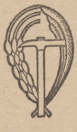
C. N. S.