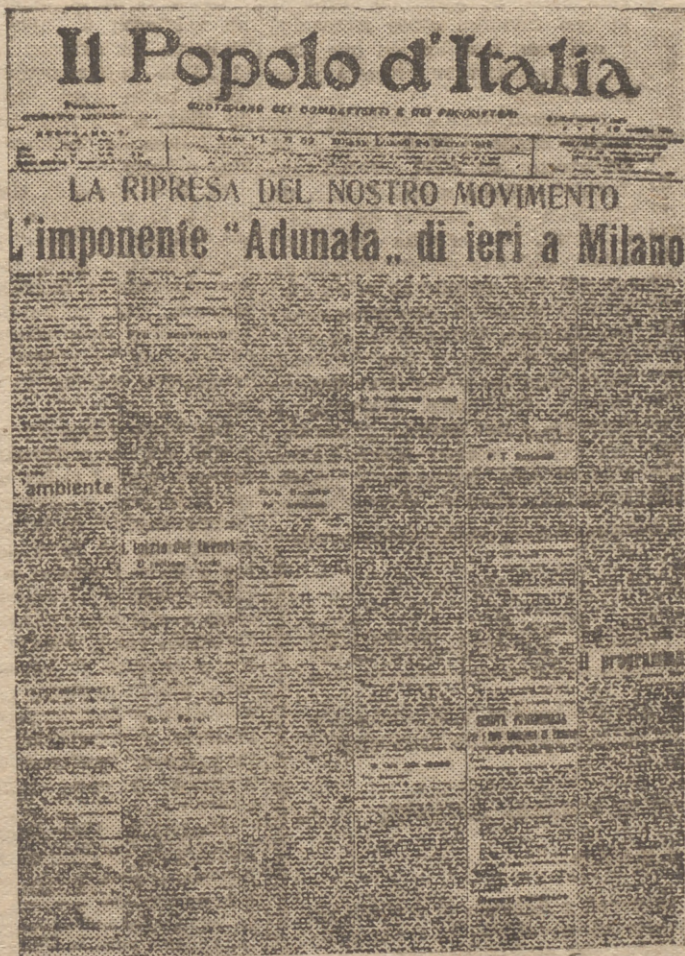
HE aquí la primera página del "Popolo d'Italia" de 24 de Marzo de 1919 que fué en unión de la "Idea Nazionale", órgano de los nacionalistas de Federzoni, el único diario de Italia que relató la reunión de la Plaza de San Sepulcro que debía abrir un período de gloria en la historia de Italia.

La Italia oficial y política se dirigía en verdad hacia el desastre. ¿Por qué no abolir el sistema parlamentario y sustituirlo con una organización soviética? afirmaban Bombacci y Barberis, los representantes de la corriente socialista jacobina y terrorista que extraviaba en aquellos tiempos a los proletarios de Ita-