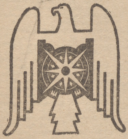
Prensa y Propaganda