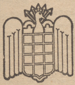
S. E. U.