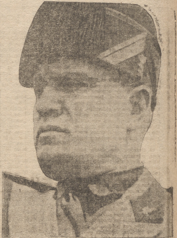
MUSSOLINI, en la actualidad, elevado a la más alta magistratura política de Italia, que su genio ha engrandecido, haciéndola temible y respetable. ¡Qué distinto el aspecto físico del "Duce" del que tenía en aquellos días juveniles, cuando luchaba por Italia en la Gran Guerra...

Los trabajadores miran tan sólo en dirección a Moscú y los tumultos y los desórdenes se suceden. El 18 de Febrero de 1919, miles y miles de hombres, mujeres y niños, agitando banderas rojas se manifiestan por las calles de Milán. El bolchevismo parecía triunfar y romper los diques de la vida social al grito de "¡Vivan los Soviets!" Los burgueses se encierran en sus casas, lívidos, deprimidos por el más vivo terror y como la bandera de Italia era también blanco preferido de la cruzada, poco a poco irá siendo retirada de los balcones. En Abril los partidos rojos proclaman en Italia la huelga general por el simple hecho de haber prohibido el Gobierno una manifestación de homenaje a Lenin. En Mayo se declara la huelga en Turín en honor a Rosa Luxemburg, asesinada en Alemania. Otra huelga en Junio para protestar del alza de las substancias mientras la noche oscura asalta los almacenes. Los tenderos y almacenistas están ya tan acostumbrados a los saqueos del pueblo hambriento que cuando los saqueadores se presentan, ofrecen sin vacilar las llaves de las depósitos y locales a los "conductores" del pueblo. Escenas de rapiña seguidas de muertes y atentados tienen lugar en Milán, Bari, Messina, Génova, Savona, Nápoles, Roma, etcétera. Un experimento de Gobierno comunista se intenta el 12 de Junio en Sestri Ponente y