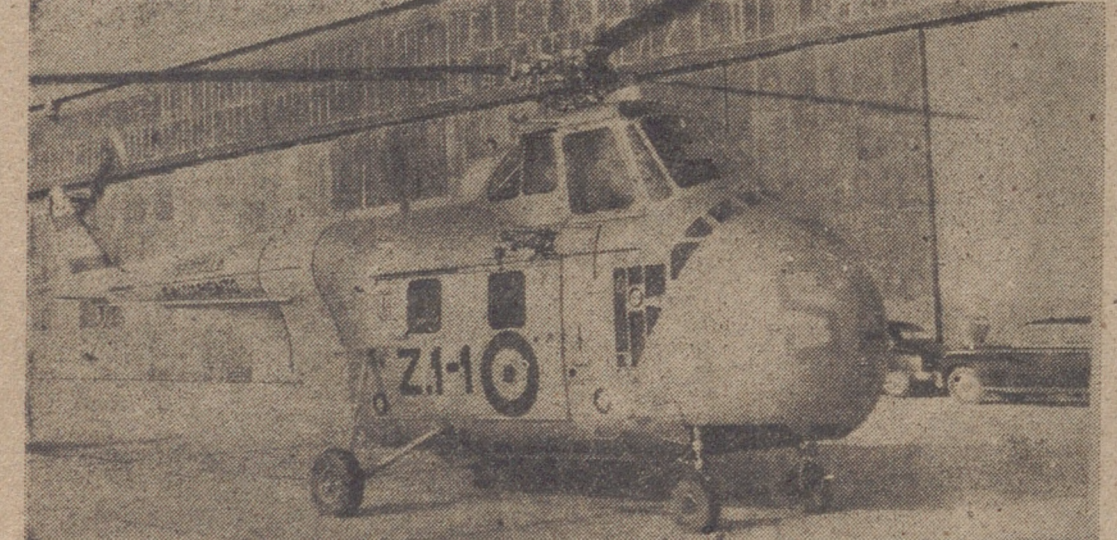
Autogiro en que sobrevoló las zonas siniestradas el Ministro de Agricultura