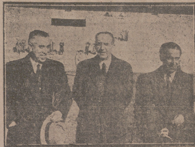
Alcantara, Ileta y Quesada, que hoy volverán a reunirse en Chamartín para observar por última vez a los aspirantes y decidir el equipo que parece tienen elegido.