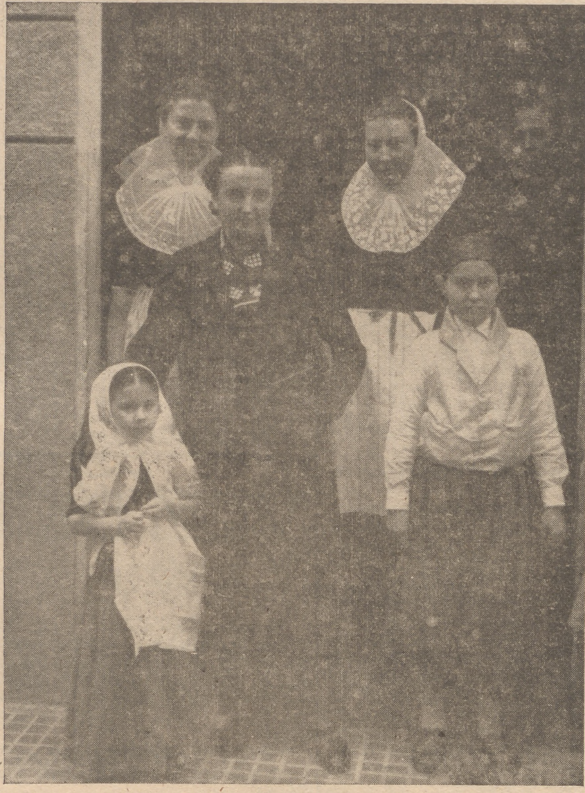
LA POLITICA SOBRE NORDAFRICA