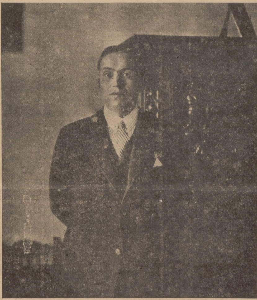
Los versos espléndidos de José M. Pemán, en su poema «La Bestia y el Angel», dibujan de forma magistral la figura de José Calvo Sotelo. Las estrofas soberbias dicen así: