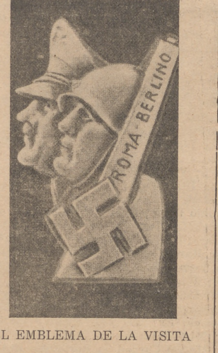
EL EMBLEMA DE LA VISITA