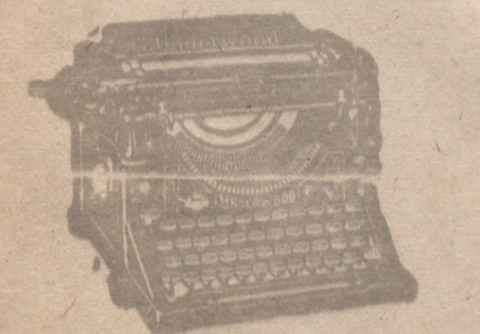
Máquina «Underwood» de Oficina y otras marcas