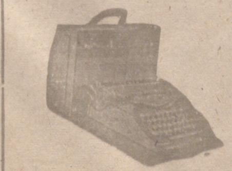
Máquinas de escribir portátiles y otras marcas