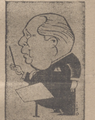
El inspirado maestro don Pablo Luna, dirigiendo la orquesta del Teatro Lope de Vega en la función de homenaje que ayer se le dedicó.