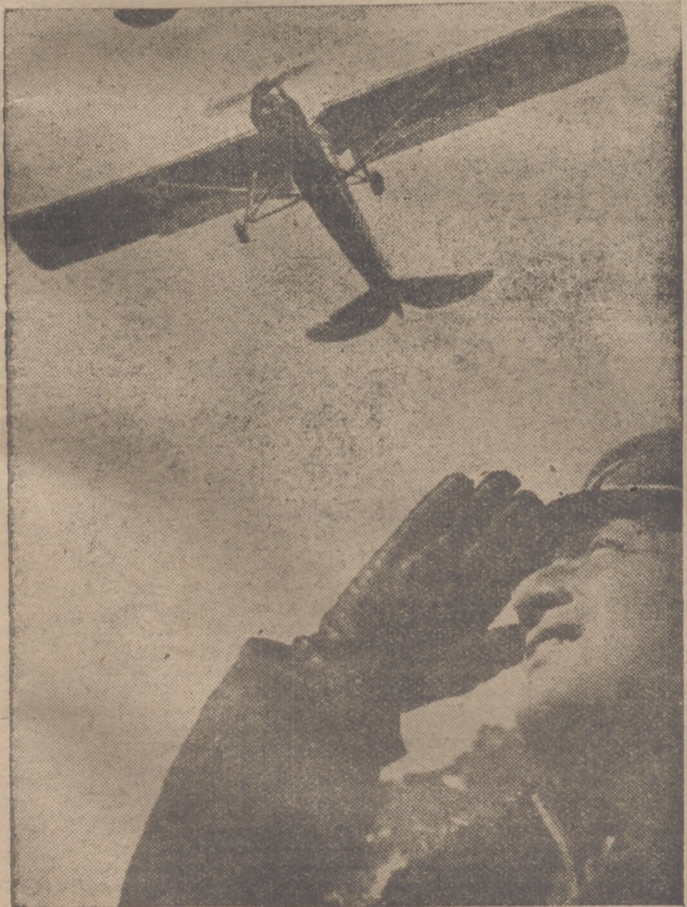
Este es el aspecto del "Storch" en vuelo lento. Las alas suplementarias dispuestas al borde delantero de los planos, han sido retiradas y vueltas hacia abajo las aletas del borde trasero.

de unos y el espíritu de reivindicación sistemática de otros, espíritu que usurpa las atribuciones del individualismo y de la libertad, hace imposible todo esfuerzo colectivo y arruina todo ideal. En el nuevo orden francés la fortuna no dará derecho ni a la ociosidad ni al mando. El nuevo Estado no reconocerá más jerarquías que las de los aptos.—Efe.