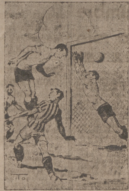
El tercer tanto del Delicias (Apunte por ITO)