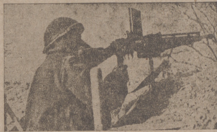
Un soldado finlandés vigila con una ametralladora desde un puesto avanzado

población soviética. El periódico "Uusi Suomi" dice que en la ciudad de Leningrado se han producido desórdenes y que la multitud ha asaltado un tren de mercancías cargado de provisiones.