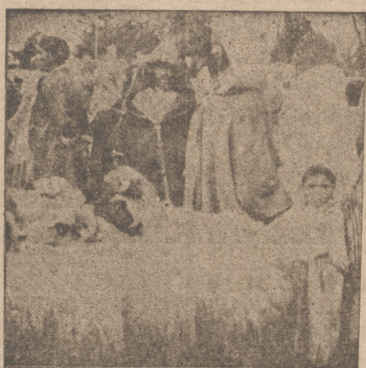
Sabido es que cada hogar marroquí, por muy pobre que sea, ha de sacrificar en la próxima Pascua del Aid-El-Quebir uno de estos animales. He aquí un aspecto del Zoco Grande, al que afluyen estos días los musulmanes en busca de la víctima que deberán inmolarse.

Un optimista cree que la guerra acabará en el próximo invierno