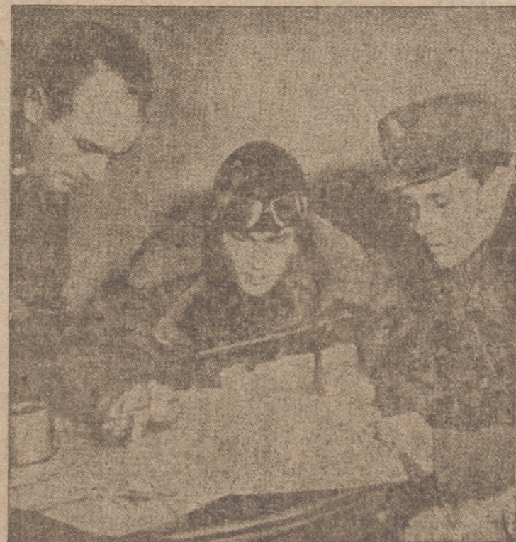
Aviadores finlandeses consultando un mapa

En el sector de Kotkojoki nuestras patrullas aniquilaron a varios destacamentos importantes del ejército rojo. La ciudad de Jon-