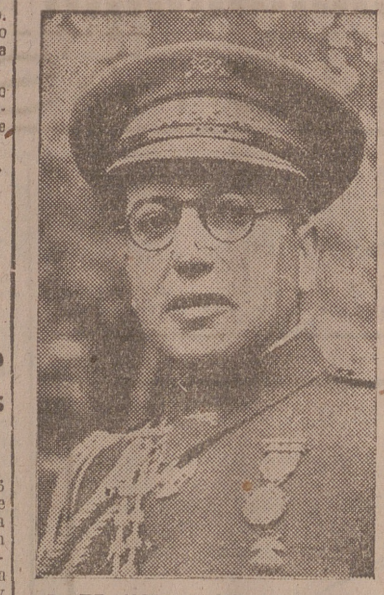
D. FRANCISCO FRANCO SALGADO Coronel de Infantería, que ha sido nombrado jefe de las fuerzas de la Casa Militar de S. E. el Generalísimo