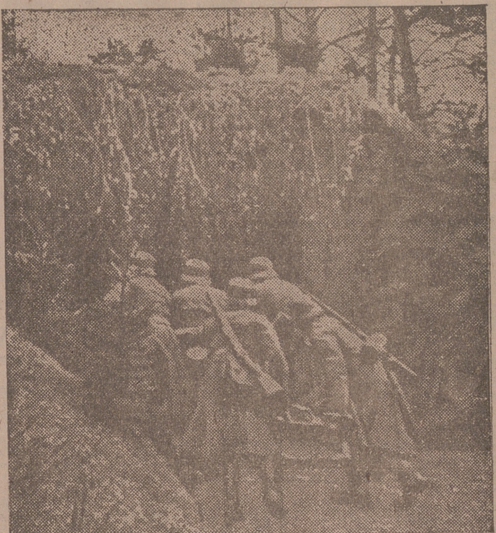
Mientras los partes de guerra no registran novedades dignas de mención, la artillería de ambos ejércitos dispara sin cesar contra las posiciones enemigas.—Aquí tenemos una pieza alemana preparándose para hacer fuego desde su emplazamiento en la línea Sigfrido.