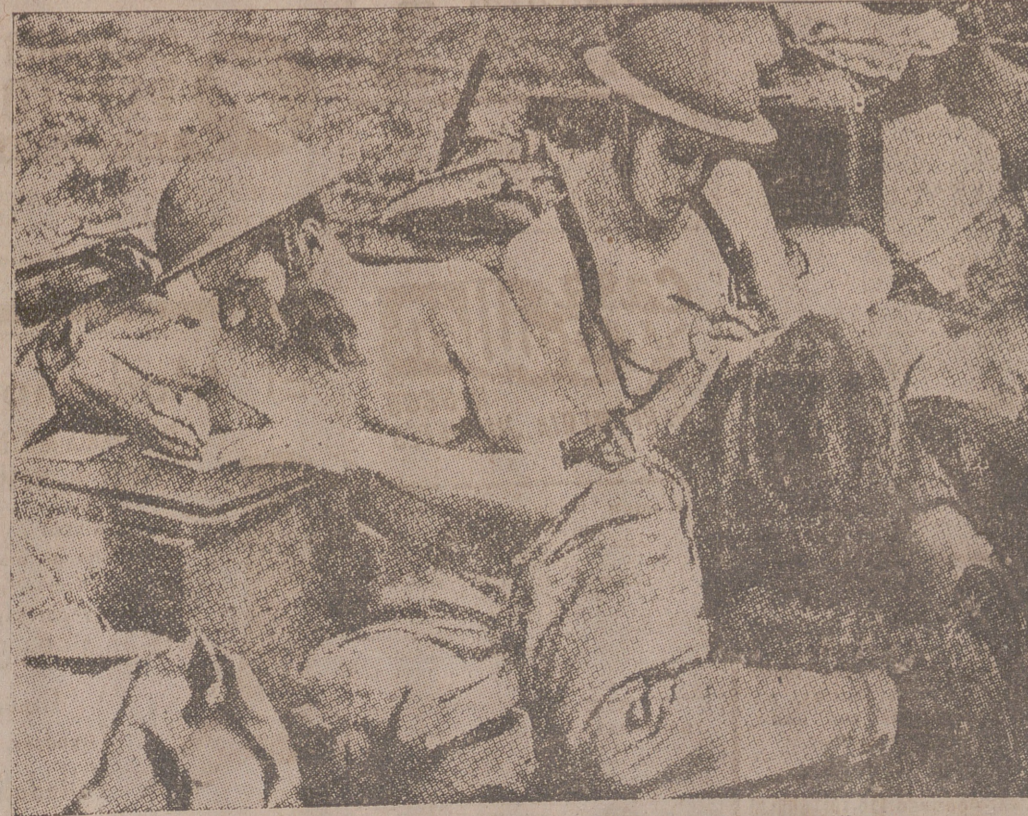
En el campo de Monmouth, en el País de Gales, dos soldados ingleses escriben su correo, mientras se abroncean al sol