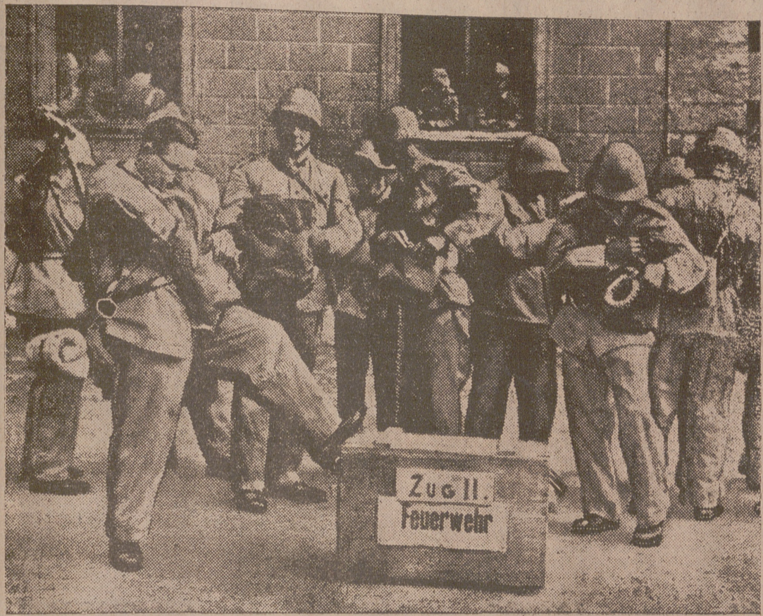
Reclutas alemanes recientemente movilizados esperan en los cuarteles la orden de salir para el frente.