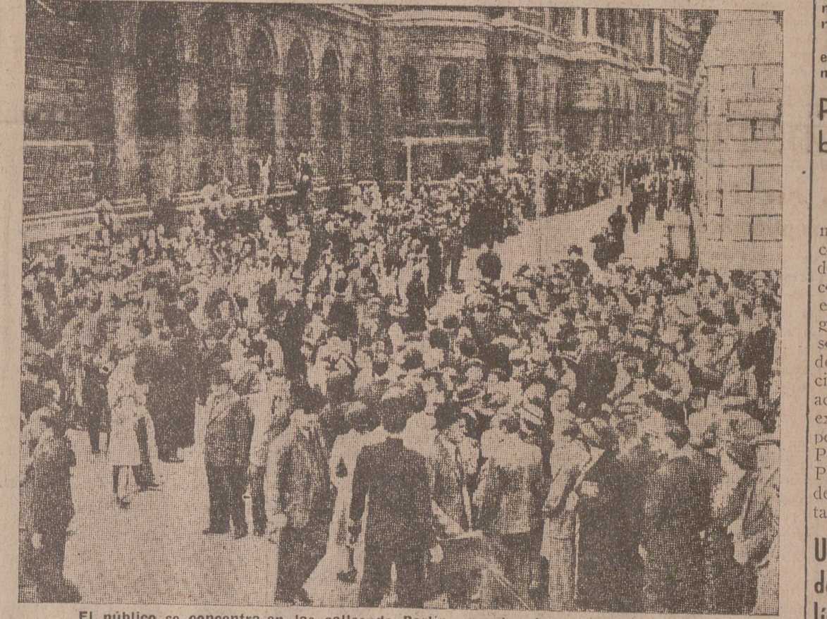
El público se concentra en las calles de Berlín, escuchando el curso de la guerra

Por último, afirmó que hablaba de buena fe y que no quería prolongar una discusión que le ponía todavía en situación más apurada.