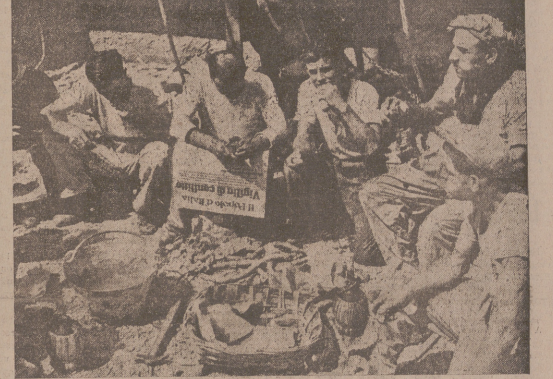
La noticia de la guerra es leída y comentada con admirable serenidad por los obreros italianos. He aquí una elocuente foto tomada en la plaza Gavour, en Milán

contar los movilizados, han salido de la capital. La circulación es muy reducida. Gran número de establecimientos han sido cerrados. Todos los agentes destinados al orden público circulan provistos de caretas anti-gás. Las oficinas públicas y los Ministerios han evacuado rápidamente sus archivos hacia el interior del país, donde han quedado instalados.—Stéfani.