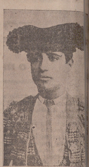
«El Gallo» en la época de presentación ante el público.