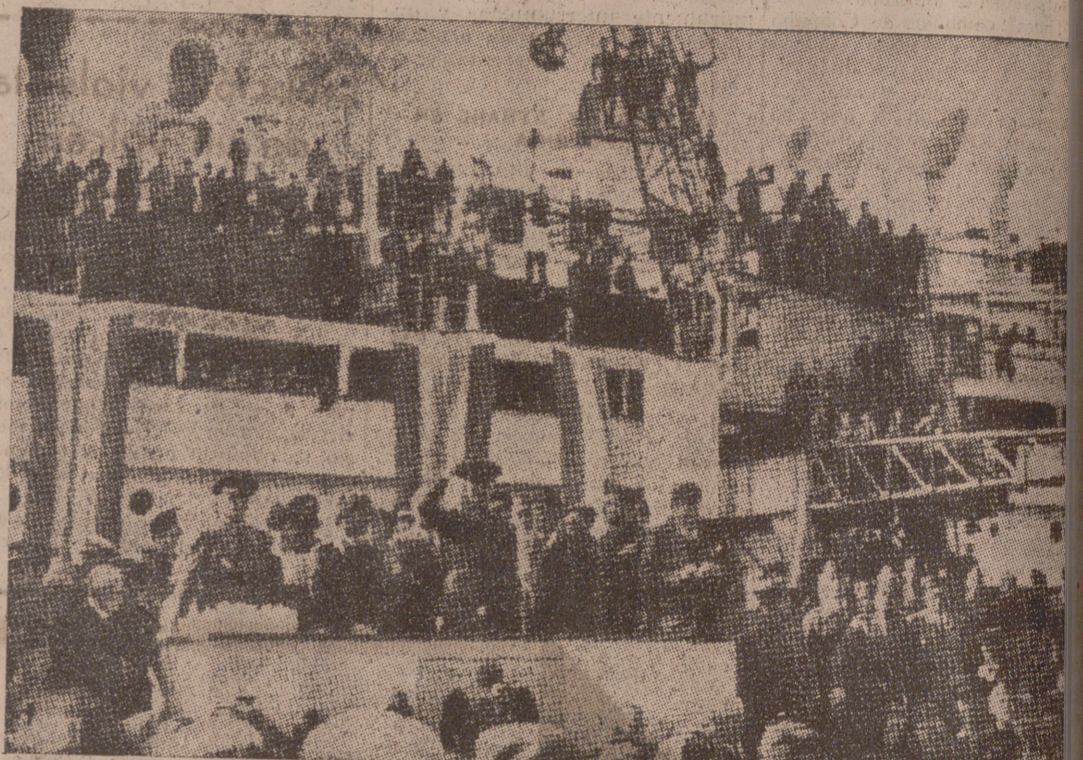
Momento en el que parten para Italia los legionarios italianos. El general Queipo de Llano, en primer término, despidiendo a los valerosos que vuelven a su Patria

En LONDRES se concede gran interés al regreso de los ITALIANOS