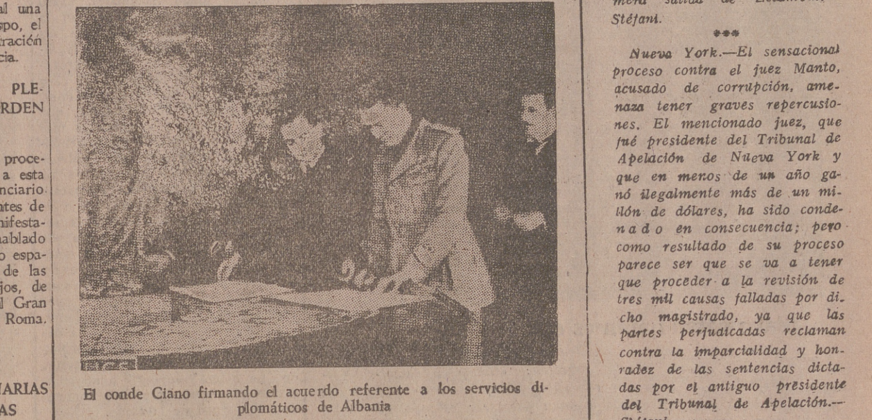
El conde Ciano firmando el acuerdo referente a los servicios diplomáticos de Albania