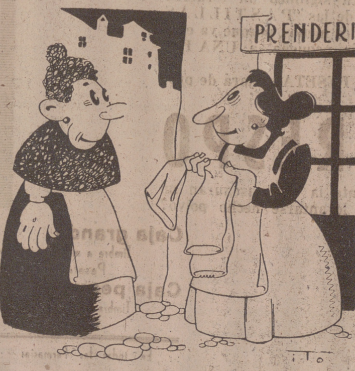
COMPRA-VENTA Por ITO. — El pantalón no está mal; pero ¿qué pongo para las vueltas? — ¿Para las vueltas? Póngale sellos.

Al lugar del accidente llegó el destructor "Orage" y varios remolcadores. — T. D.