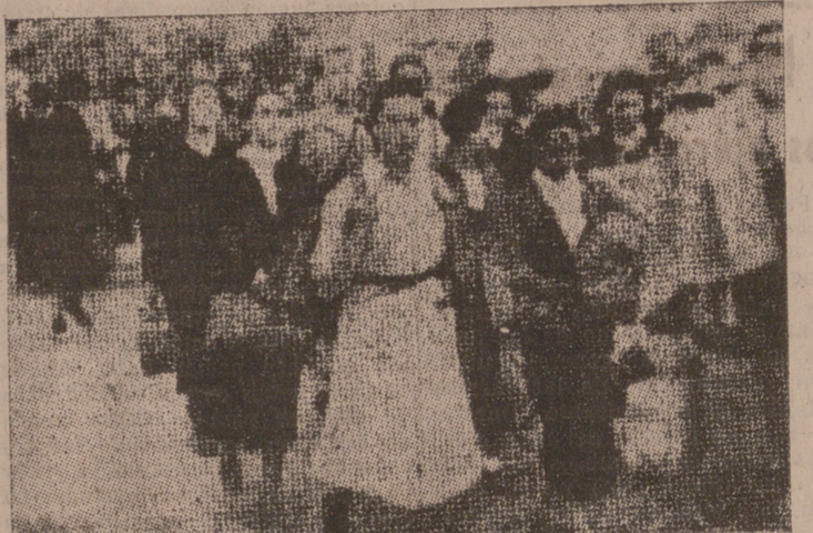
Durante la dominación roja muchos madrileños hicieron la promesa de ir a pisá al Santuario del Pilar de Zaragoza. He aquí un grupo que sale carretera adelante para cumplirla.