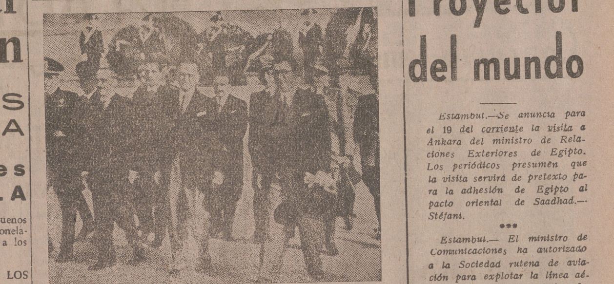
La Misión albanesa después de haber rendido homenaje al soldado desconocido ante el altar de la Patria