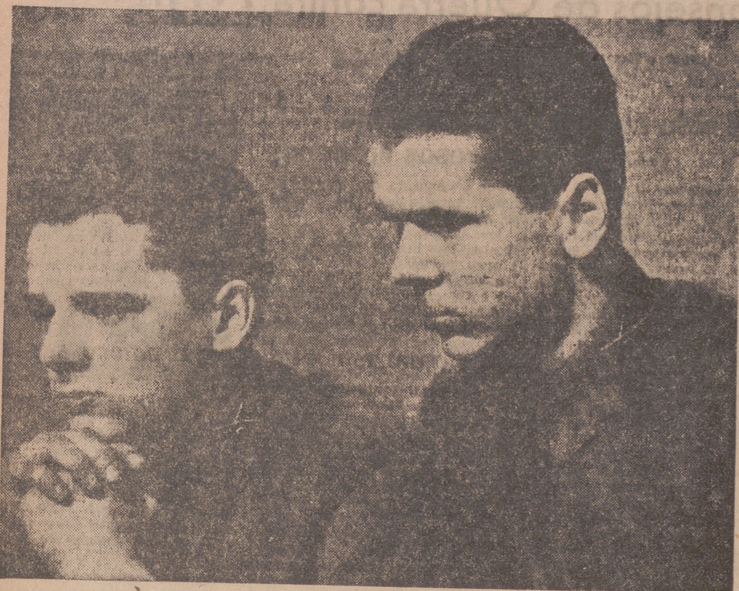
Freddie Bartholomew y Jackie Cooper