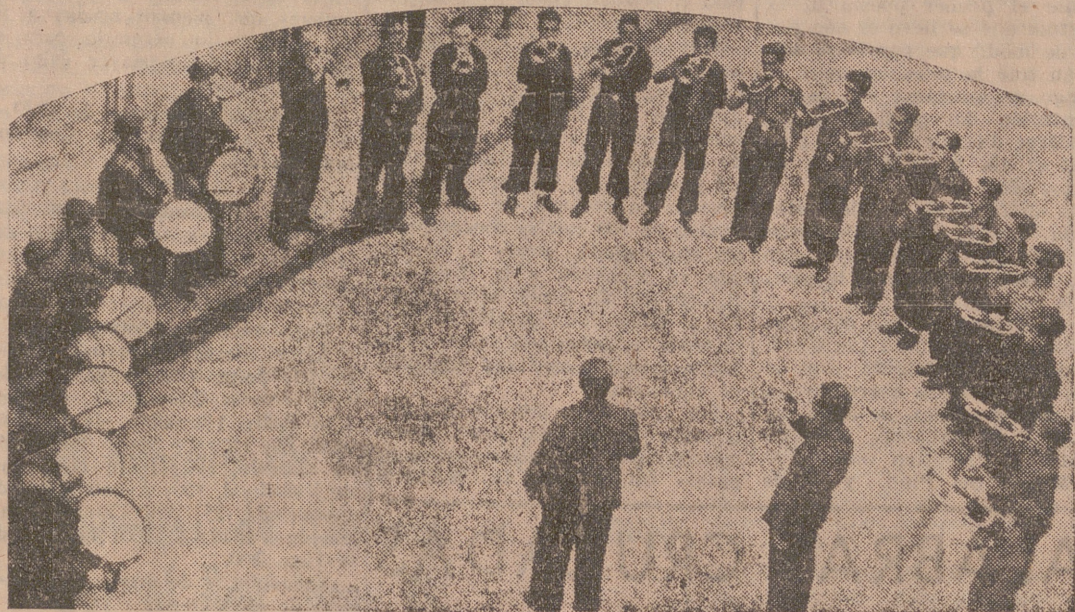
La Banda de cornetas y tambores de Organizaciones Juveniles

Verdaderamente nuestro esfuerzo de la guerra no puede quedar en el aire. Pero solamente con decirlo y con mirar reposadamente el fin de la campaña podemos aminorar el efecto y el ejemplo del triunfo. Dormirse sobre los frescos laureles significa el fracaso; es también absurdo volver para pensar en el dulce sonido de los cantares de gesta. Porque el combatiente es un hombre, enteramente un hombre en medio de muchos que no llegan a este mayúsculo significado y con un prestigio forjado ante las balas. Hemos de seguir, pues, caminando por la ruta del trabajo y sobre todo sentir la gran inquietud de nuestro papel decisivo, no permitiendo que se malogre, fomentando, ayudando la labor de los que nos siguen.