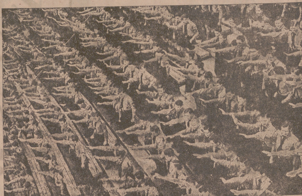
123.000 muchachos de las Organizaciones Hitlerianas saludando al Führer en el estadio olímpico de Berlín