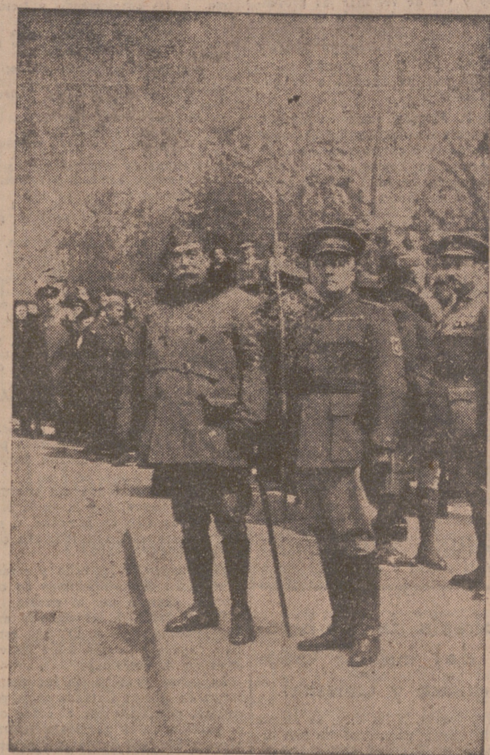
Los generales Saliquet, jefe del Ejército del Centro, y Espinosa de los Monteros, jefe del Cuerpo de Ejército de Madrid, durante el desfile celebrado el pasado domingo en el paseo del Prado de Madrid.