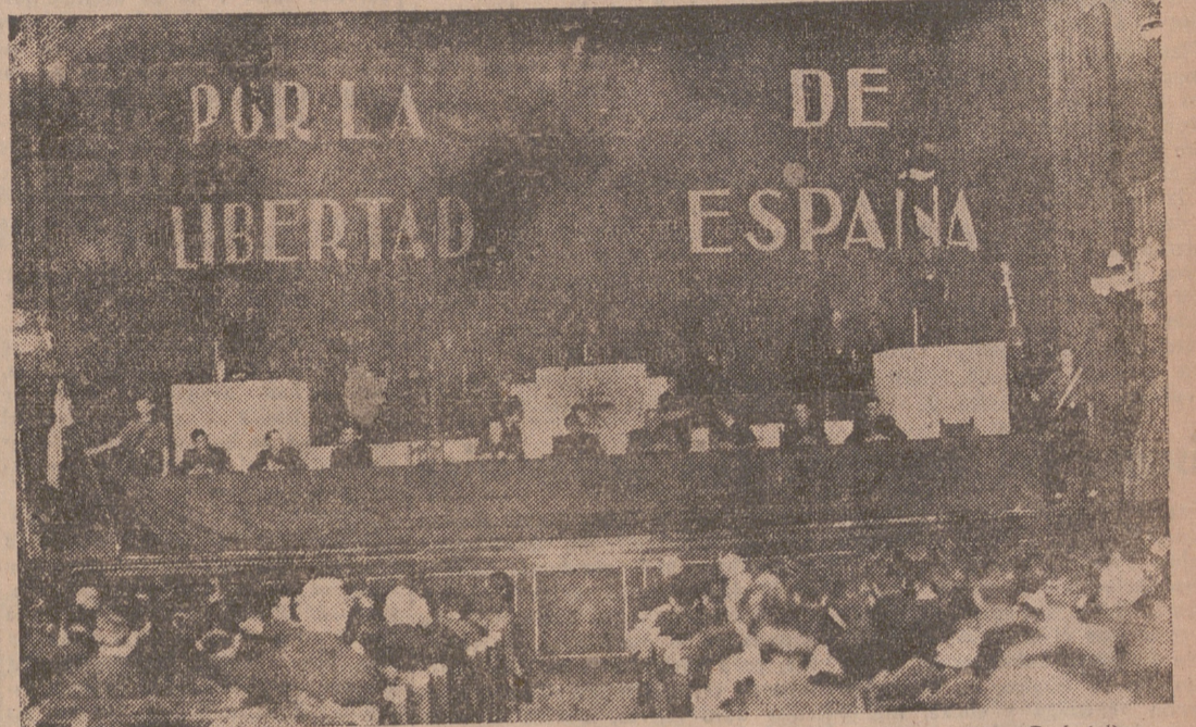
LA PRESIDENCIA DEL ACTO

A partir de aquella fecha y particularmente en la primera guerra civil, las dos naciones "amigas" organizaron un pacto que se llamó de la decadencia, en el que tomaron parte Francia, Inglaterra, Portugal y España. Pero desde aquella fecha perdió España su libertad. Desde entonces aquellas dos naciones la habían atado muy bien; ya se nos dominó por las armas. Desde entonces las armas de la esclavitud se llamaron consejos de administración de minas y ferrocarriles; se llamó de los técnicos extranjeros; contra los que hoy también el pueblo español vuelve a alzarse sereno y tranquilo. Esta es la época de la venta de las minas, de la venta de todas las riquezas del pueblo español, y es la época en que vienen de Francia las ideas revolucionarias y contrarrevolucionarias; es la época de las logias masónicas; es la época en que nuestras riquezas religiosas van a París y camino de santuarios extranjeros es la época en que todavía nuestros burgueses van a París, y es la época