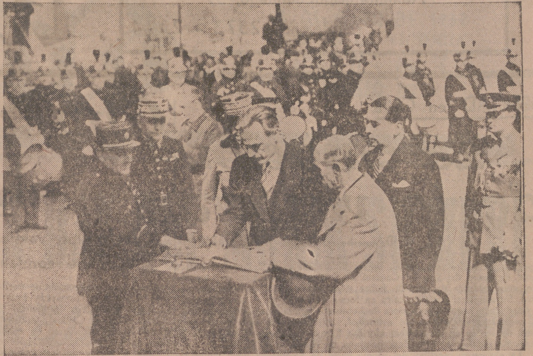
El señor Gafenko, ministro de Asuntos Exteriores de Rumania, firmando en el Libro de Oro en el Arco del Triunfo de París