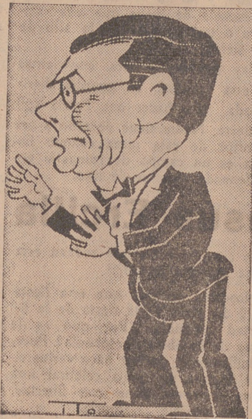
DEMON Director de la gran Orquesta titulada «Demon's Jazz», que actúa en Calderón de la Barca