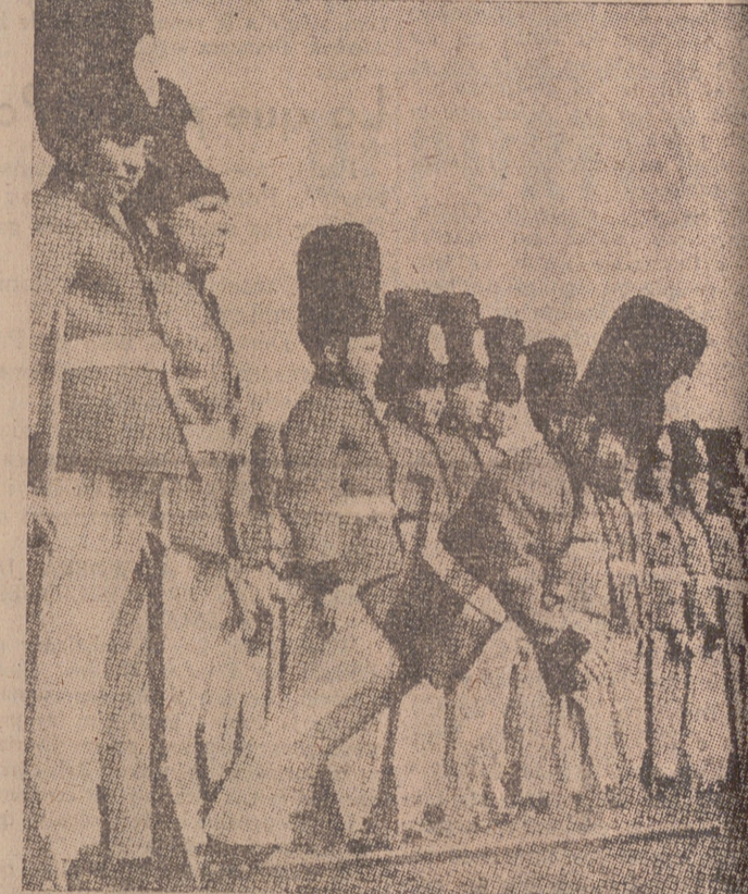
Arriba.—Un crecido número de "gentlemen" escuchando al apocalíptico Mr. Winston Churchill, que les anima a alistarse en el Ejército. Abajo.—Los alumnos del Colegio Militar de Dover, haciendo instrucción con fusiles de madera.