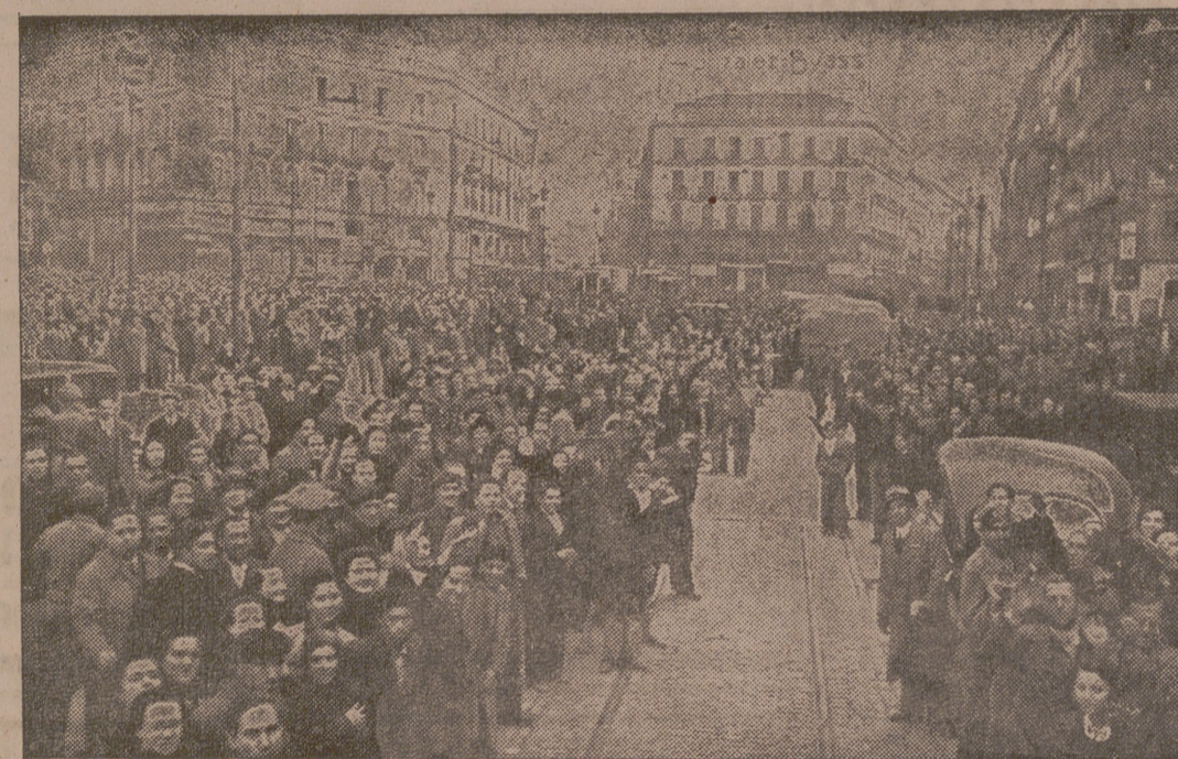
ALEGRIA DEL PUEBLO DE MADRID.

No concluye ahí la labor de "Auxilio Social", cuya consigna es la de superar siempre en pro del indigente. No por caridad limosnosa, sino porque ese es el sentido que nosotros damos a la Justicia Social que el Nacional-Sindicalismo pregona en sus postulados.