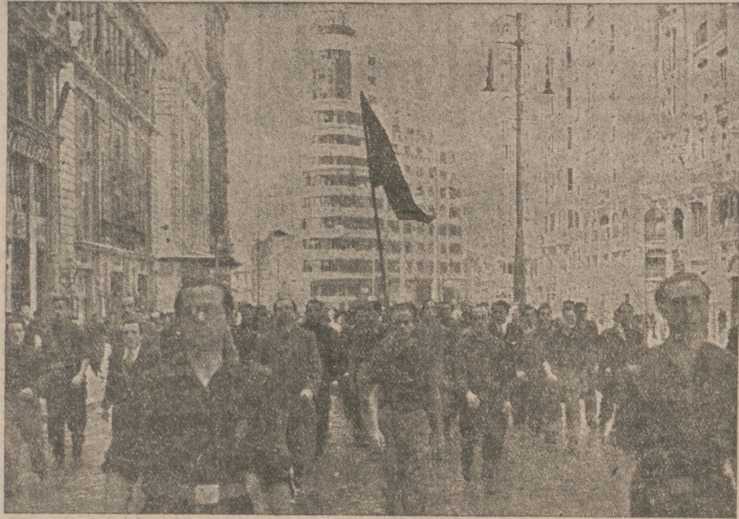
La Falange madrileña, formada por jóvenes que durante la dominación roja han permanecido encarcelados, desfila por la Gran Vía