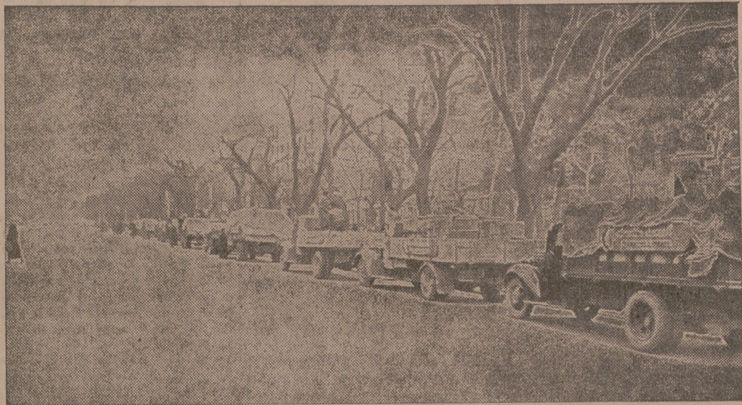
Convoy con víveres de "Auxilio Social" por las calles de Madrid.

Desde el primer instante de la liberación de Madrid funciona una Oficina Central, un Almacén Cen-