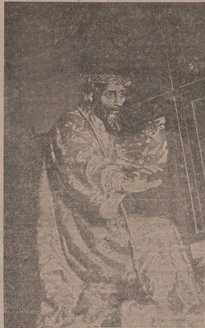
Imagen que se venera en la Iglesia rotorial del mismo nombre, que saldrá procesionalmente en la tarde de hoy