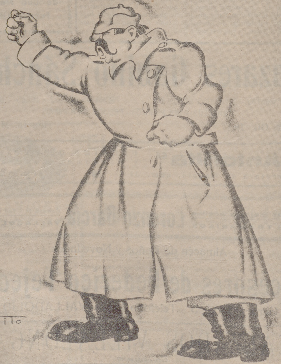
¡¡¡Berlín y Roma me están partiendo por el ojo!!!