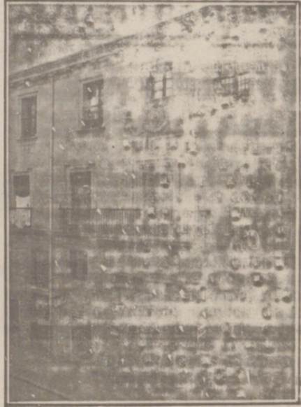
Entrada a las Oficinas de la Federación y MUTUALIDAD AGRÍCOLA BURGALESA. Calle de Santander, números 10, 12 y 14, Burgos.

En ella están las Oficinas de la FEDERACIÓN, CAJA DE AHORROS, MUTUALIDAD AGRÍCOLA BURGALESA y Redacción y Administración de «El Castellano» y «El Defensor de los Labradores»