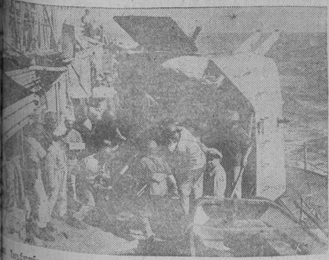
Artillería costera italiana preparada para rechazar una flotilla inglesa que intenta aproximarse a la costa.

Madrid, 2.—La Junta Política y el Consejo Nacional de Falange Española Tradicionalista y de las J.O.N.S., celebrarán esta semana dos reuniones para dar a conocer a sus miembros la promulgación de la Ley Sindical.—(Cifra).