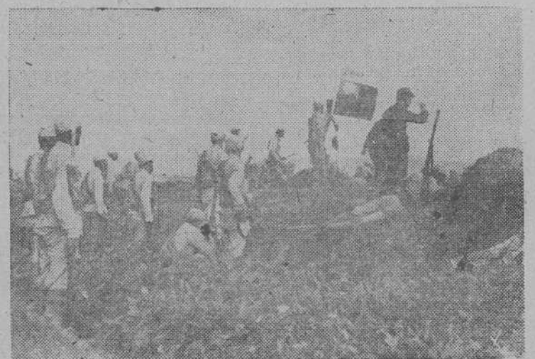
Tropas del Gobierno de Nankín, proclamado como el único legal de China, ocupan nuevas posiciones de gran valor estratégico.