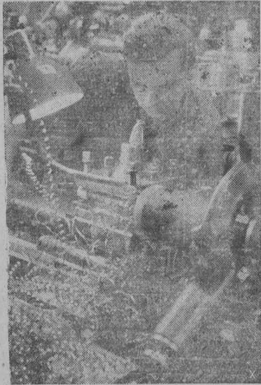
Con su trabajo de precisión, el obrero alemán proporciona las bases materiales para la potencia militar del Reich.

Berlín, 2.—Parte Oficial del Alto Mando de las fuerzas alemanas: