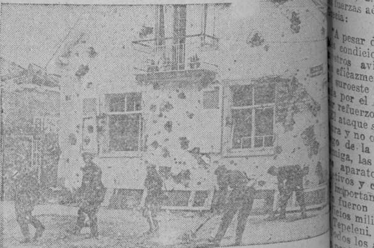
Los hombres del Servicio de Trabajo alemán botían en partes para borrar las huellas que la guerra dejó.

Aún no se conoce la fecha que Roosevelt saldrá de Washington para embarcar.—EFE.