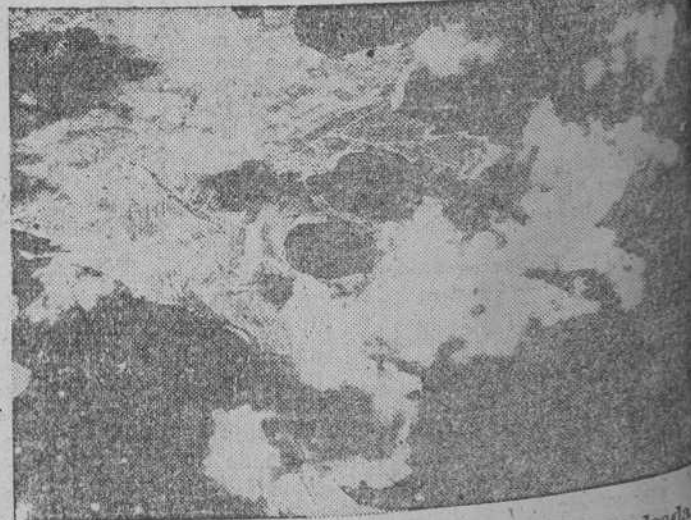
Vista aérea de la isla de Malta, que es bombardeada constantemente por la aviación italiana

En el África oriental, formaciones de tropas sudanesas han sido puestas en fuga por nuestras unidades, en la frontera de Eritrea. El convoy enemigo ya bombardeado en el mar Rojo, fue alcanzado por nuestras formaciones aéreas. Un barco averiado por las bombas abandonó el convoy, dirigiéndose a poca velocidad hacia la costa de Egipto".—Efe.