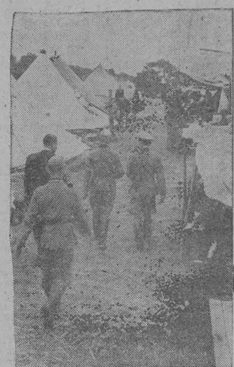
Campo de fugitivos franceses cerca de Vouziers, donde aquellos son atendidos por las autoridades de ocupación

Ha sido entregado a Inglaterra el tercer grupo de destructores yanquis