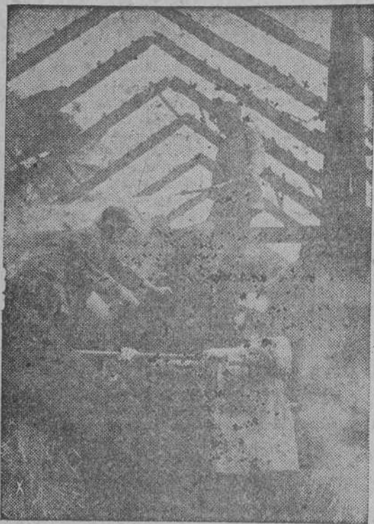
Sofocando el incendio producido por una bomba incendiaria inglesa