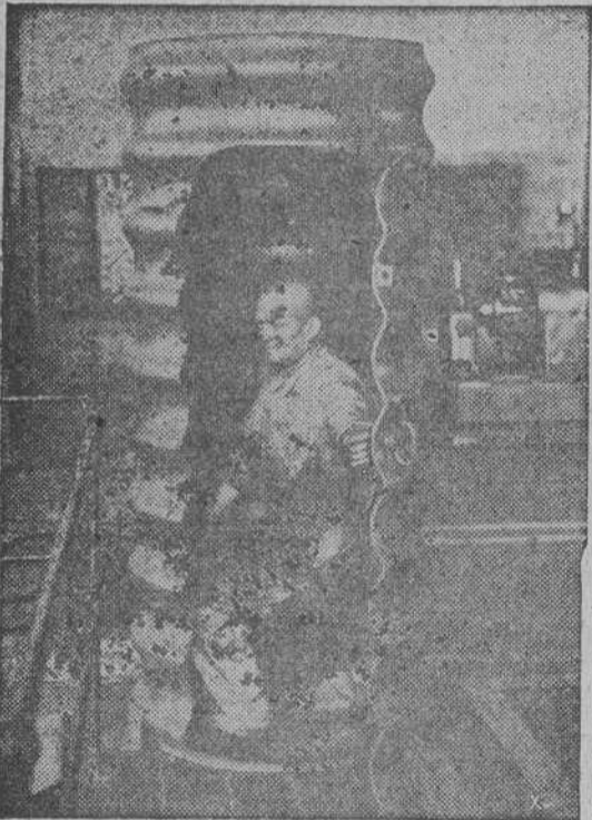
Refugio individual que se ha instalado en muchas fábricas alemanas