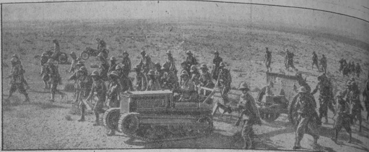
Una sección de artillería italiana avanzando en las áridas tierras del desierto