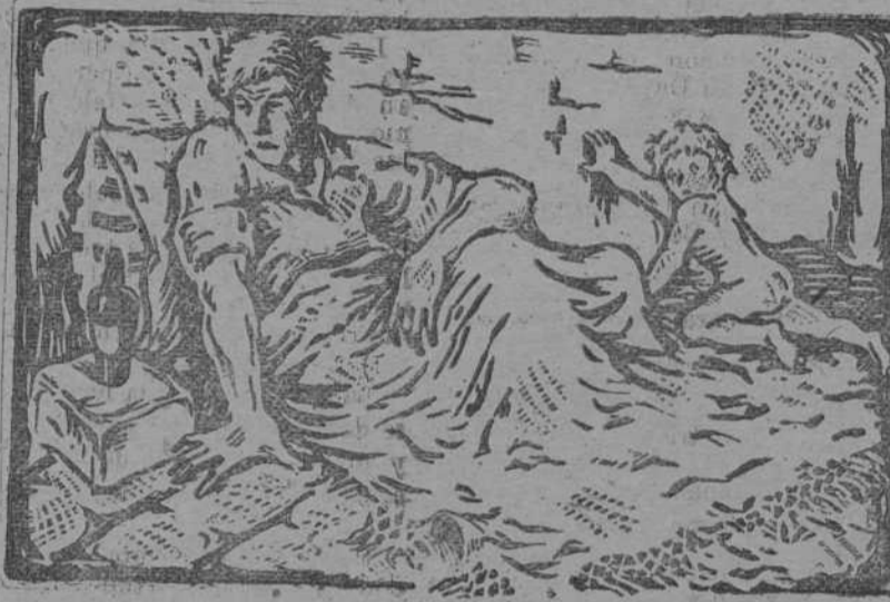
Por evitar la inmundicia promiscua de estas zahurdas, donde los seres humanos se arrastran como bestias, el Caudillo dispone inflexiblemente nuevos rumbos en el problema de la Vivienda