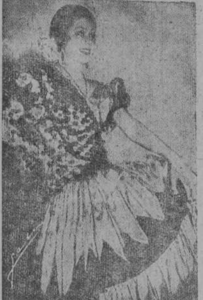
PASTORA SOLER, genial intérprete de la canción andaluza