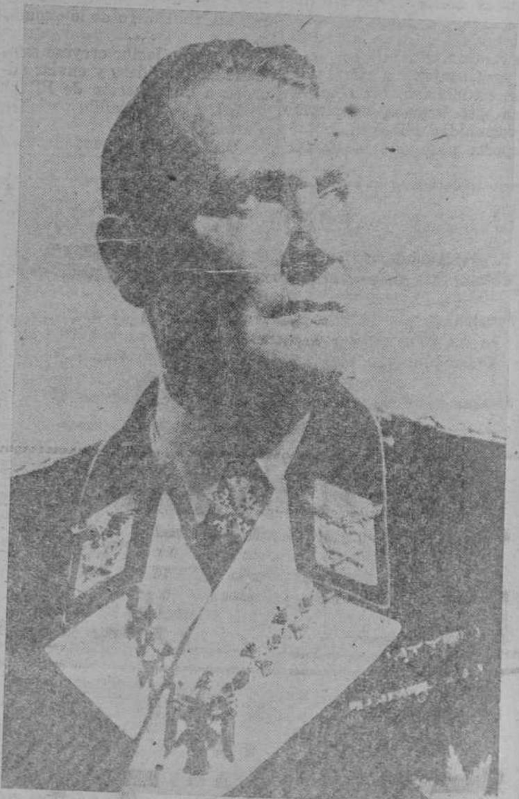
El Mariscal Hermann Goering, Ministro-Presidente de Prusia y Jefe Supremo del Aire en el III Reich, valor magnífico de la nueva Alemania, autor genial del Plan Cuadrado, a quien ha sido concedido por el Gobierno del Caudillo de España el Gran Collar de la Orden Imperial de las Flechas Rojas, con el que aparece en la presente fotografía.

A dicha comida, en la que reinó la más grata cordialidad, asistieron las autoridades civiles de la provincia.