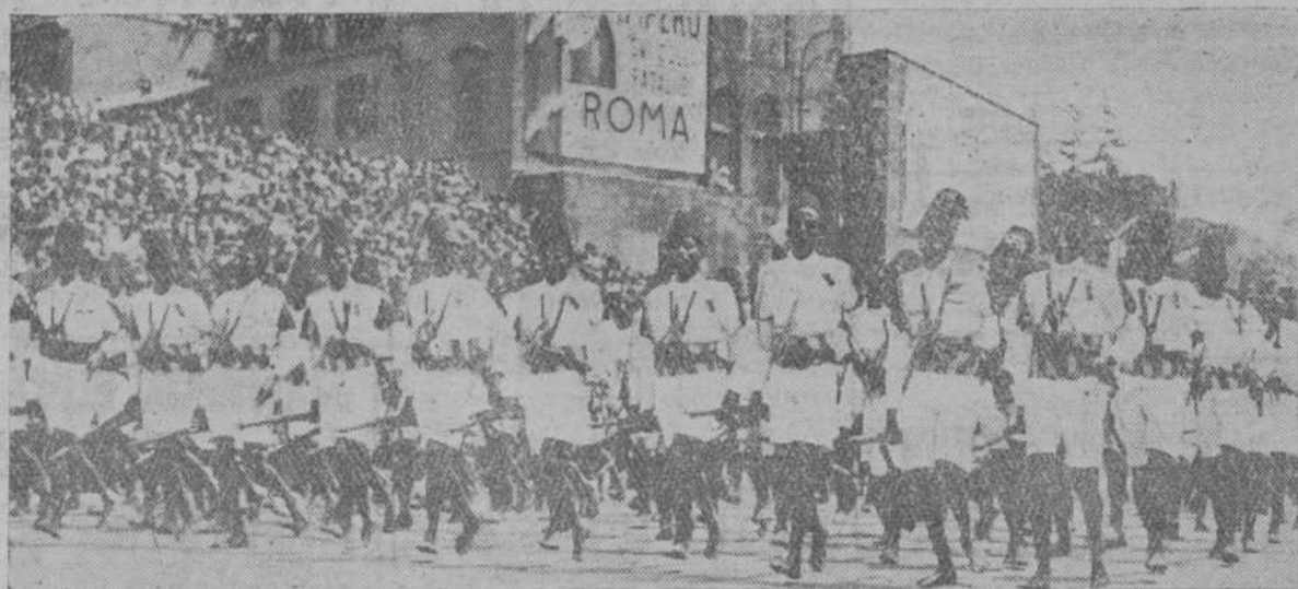
Un batallón de "ascaris" eritreos, formación regular indígena, encuadrada con oficiales italianos, desfilando por la Vía del Imperio, de Roma, en el primer aniversario de la proclamación del Imperio italiano.

patria, y a la vanguardia de las tropas armadas, fué abriéndoles el paso hacia el corazón del Imperio.