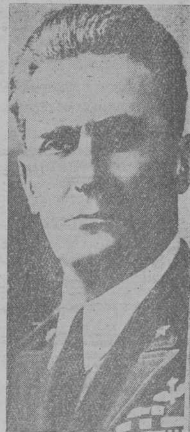
El mariscal Rodolfo Graziani, marqués de Neghelli y Segundo Virrey de Etopia.

Los mismos príncipes de sangre real o los miembros de la familia Mussolini dieron el ejemplo y su valor o sus méritos les hicieron acreedores a ser condecorados en el campo de batalla. Nunca ninguna guerra exterior fué más intensamente sentida por el pueblo; ninguna esposa italiana dejó de desprenderse del anillo nupcial para entregarlo a la Patria, que tenía necesidad de oro. Ningún militar de Italia permaneció sordo a su llamamiento, y sus condecoraciones y sus insignias engrosaron la áurea suscripción. Fué una verdadera competición, en la que todos rivalizaron en sacrificios y entusiasmo. Recuerdo aún a mis jóvenes compañeros de Universidad, que nada poseían, pedir anhelantes se les reservara un lugar en los batallones de estudiantes que se estaban formando. Pero en mi memoria, se grabó también su llegada victoriosa, desfilando sonrientes, abrazados a sus madres o a sus novias, mientras un pueblo entero les cubría con sus flores y les sonrojaba con sus aplausos. Ese pueblo que, sin excepción, cum-