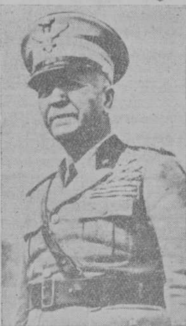
El mariscal Pietro Badoglio, duque de Addis-Abeba y Primer Virrey de Etopia.

Todos los obstáculos fueron superados por la indomable voluntad del Duce y por la disciplina del pueblo italiano, que hizo de esta empresa la empresa de la Nación. Todos la apoyaron con una confianza generosa y una intrépida decisión, convencidos de que el porvenir de la Patria estaba en juego y que de la guerra dependía su grandeza. Un millón de italianos solicitó voluntariamente ser enrolados en los cuerpos expedicionarios: muchos llegaron de América y otros de allende los Alpes. Pero todos animados con la misma fe en el triunfo y por nobles ideales de abne-