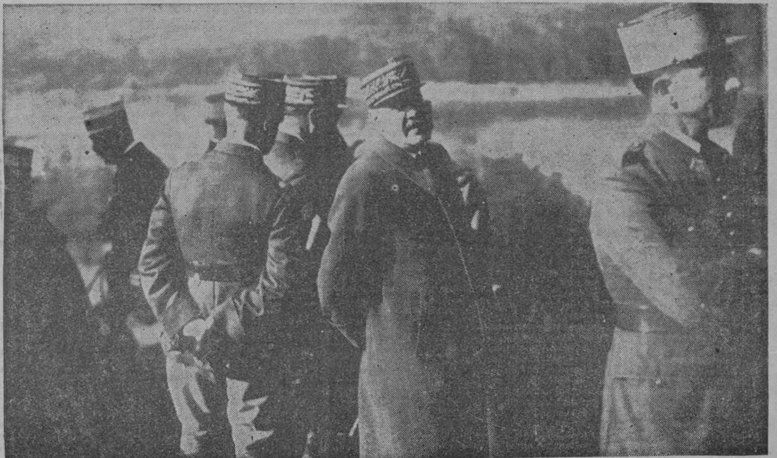
LAS MANIOBRAS MILITARES FRANCESAS EN EL RODANO

En los centros políticos se cree que la se-