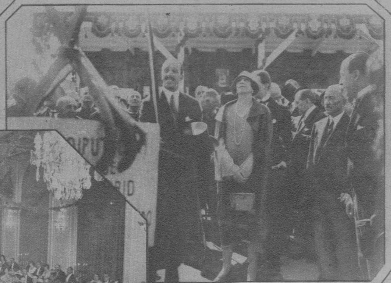
Madrid - S.S.M.M. los Reyes en el acto de la colocación de la primera piedra para el nuevo Hospicio Provincial que va a construirse en el monte de Valdeatas.