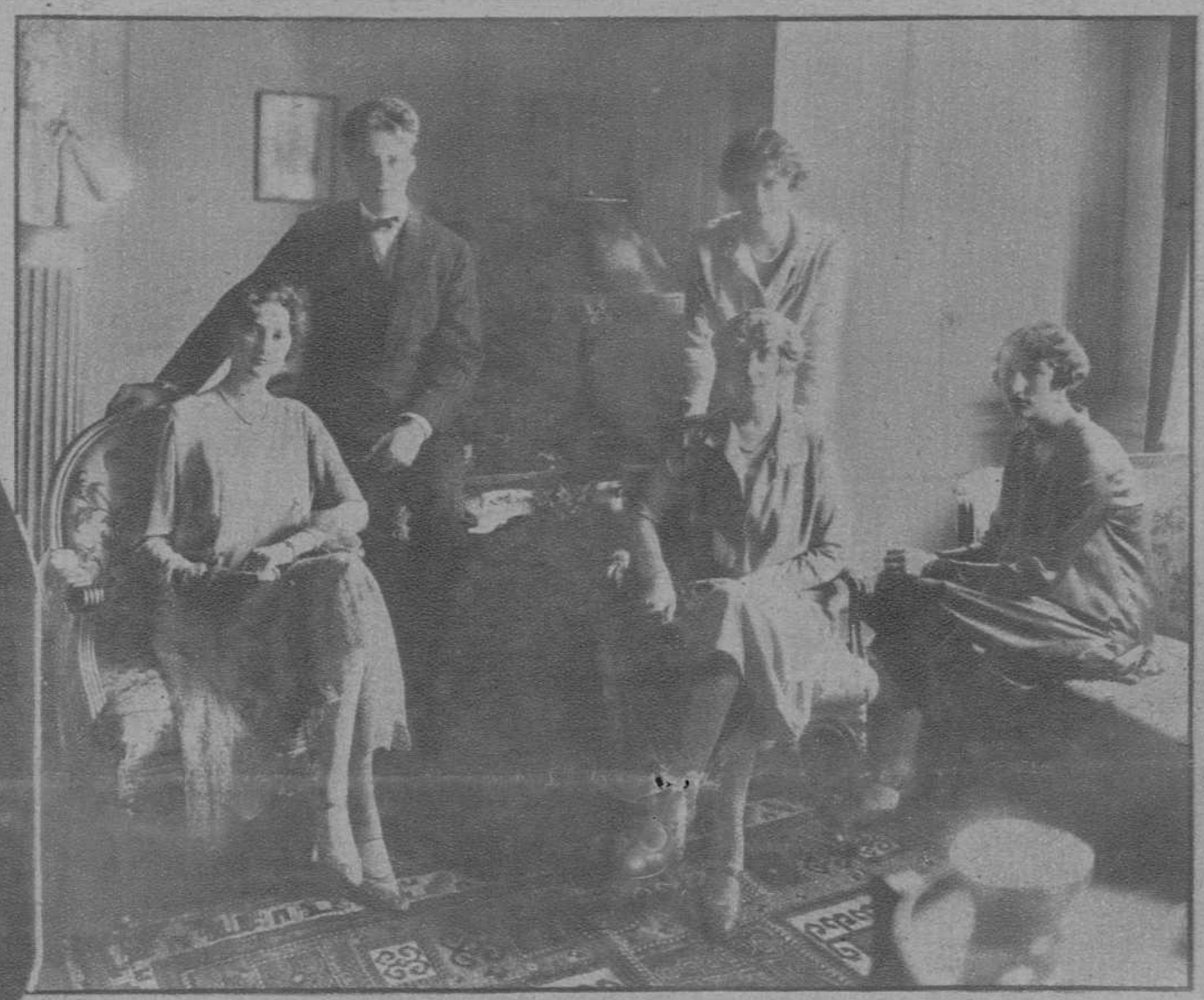
Una pareja de amor principesco - El Príncipe Leopoldo de Bélgica y la Princesa Astrid Sofía Luisa de Suecia, acompañados de la Princesa Ingeborg de Dinamarca, la Princesa Margarita y la Princesa María.

Barcelona, viernes 15 de Octubre de 1926