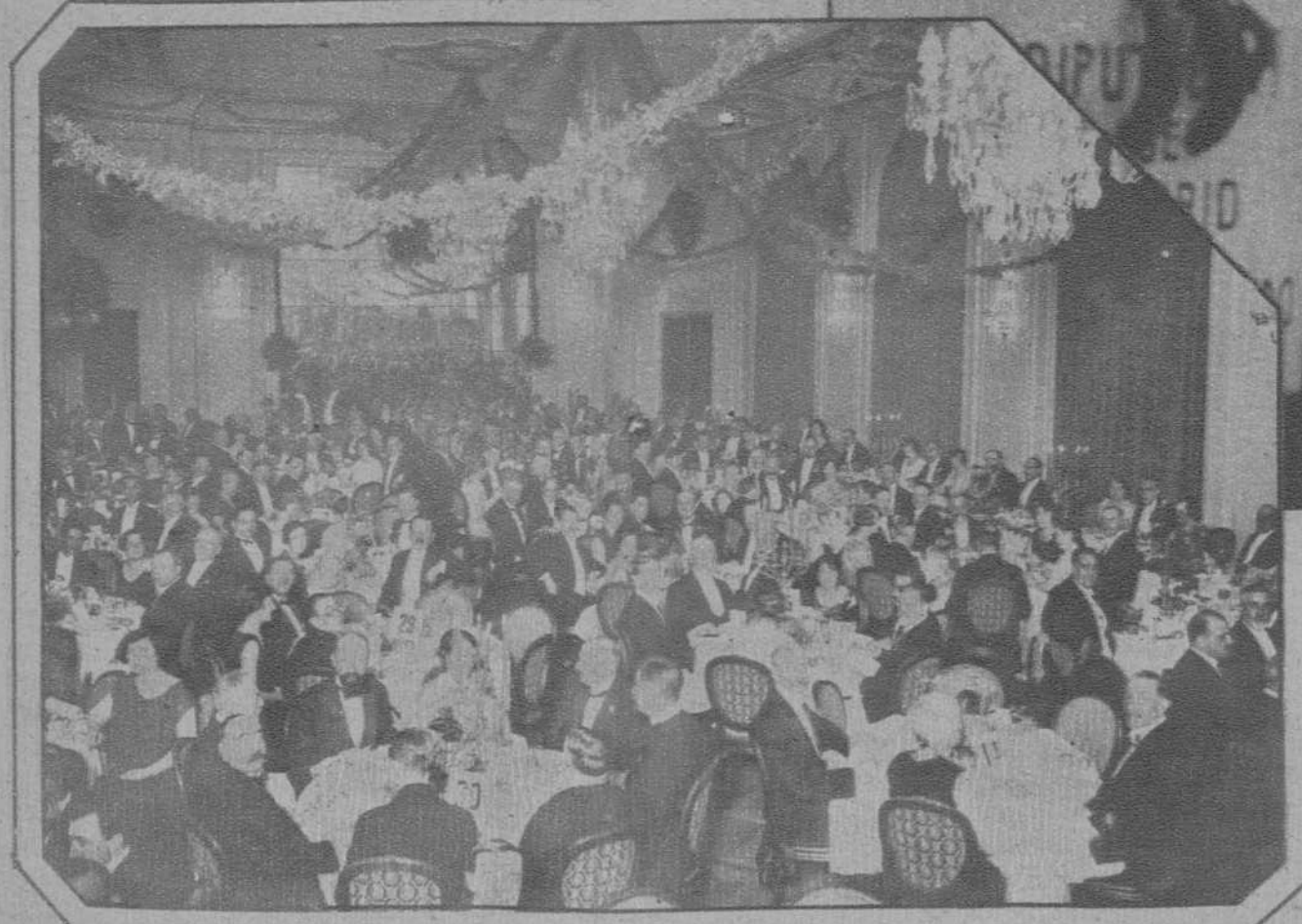
Barcelona - Banquete ofrecido por el Ayuntamiento a los asambleístas del XX Congreso Internacional de Transportes.