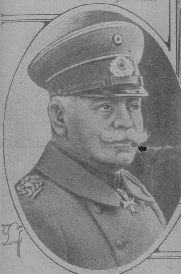
El general Heye, nuevo jefe del ejército alemán, por dimisión del general Von Seeck.