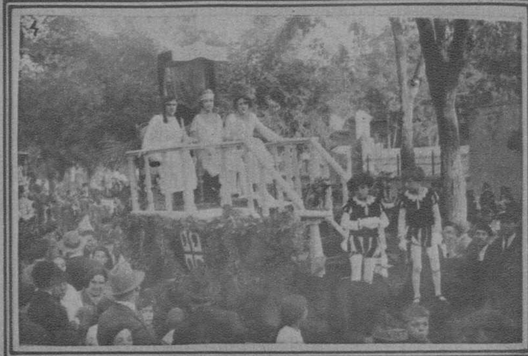
Zaragoza.-1: El general Martínez Anido en la inauguración de la nueva casa de Correos.-2: Apertura de la Exposición de Productos del Campo.-3: Las fiestas del Pilar: Carroza del barrio de San Pablo.-4: Camara del barrio de Sepulcro. (f. Barrera).