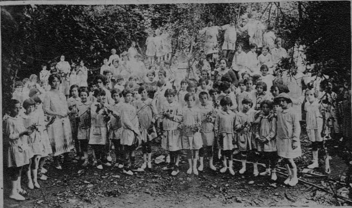
La colonia escolar de Barcelona que veranea en la "Colonia Puig".