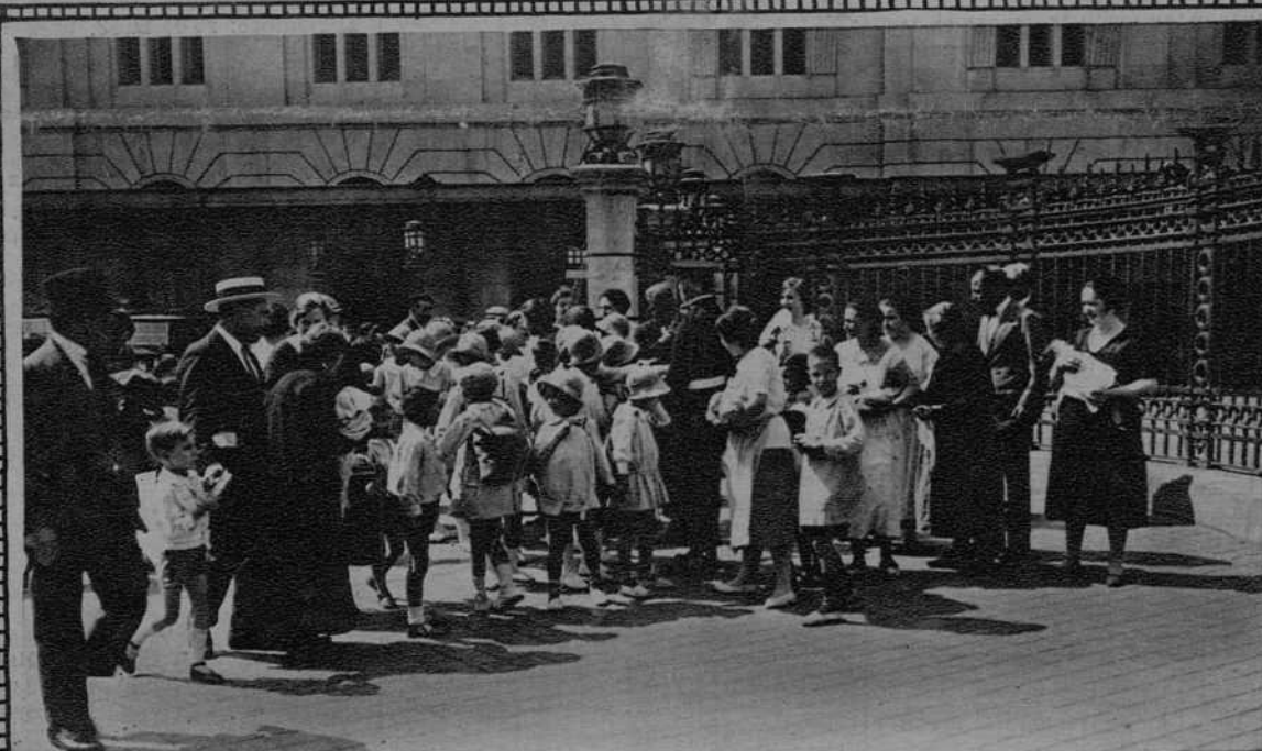
Salida a Barcelona de las colonias escolares que han veraneado en Arbúcies.