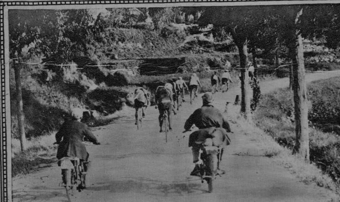
Barcelona.- Campeonato ciclista de Gracia, celebrado con motivo de la "Fiesta Mayor".