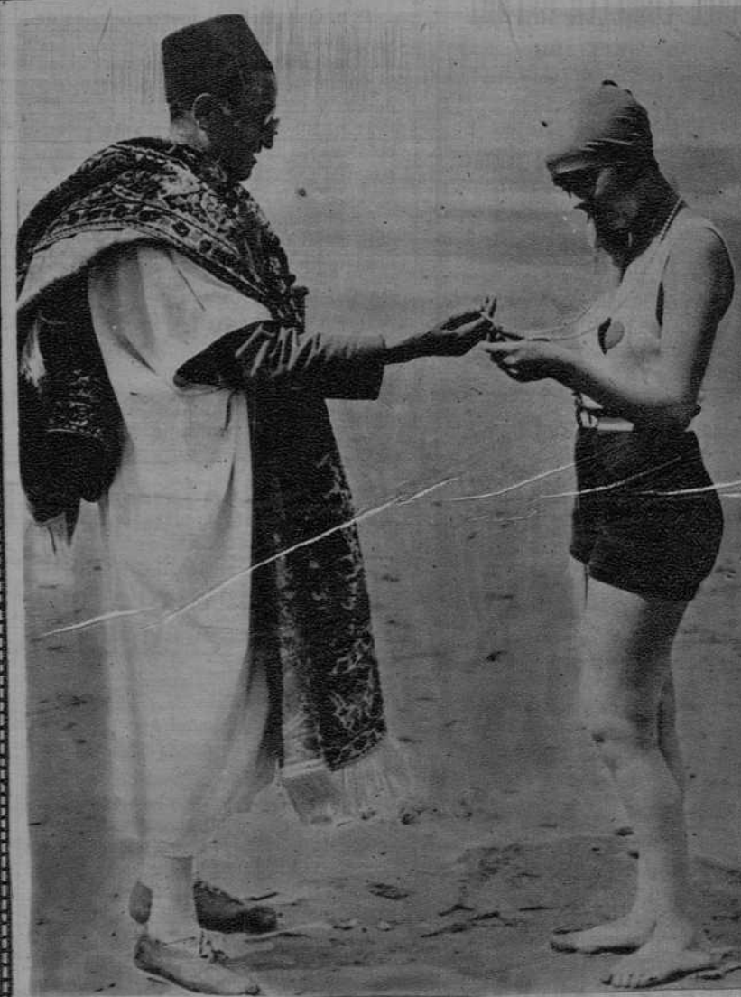
Deurville.- Durante el baño, las elegantes efectúan compras.