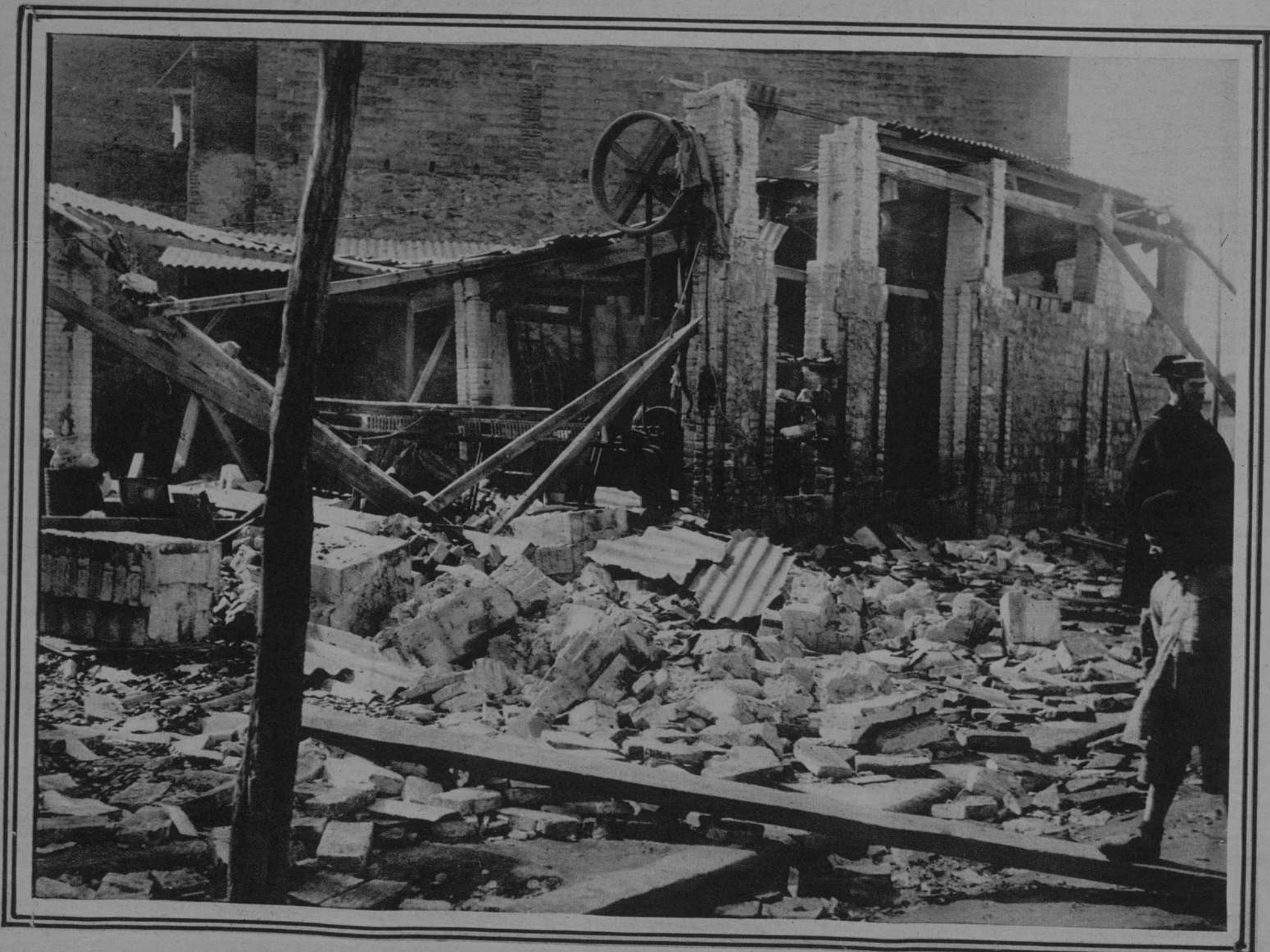
Barcelona: Estado en que quedó la fábrica de pirotecnia de la calle de Tarragona, después de la formidable explosión e incendio, que ocasionó la muerte de una niña y varias personas heridas.