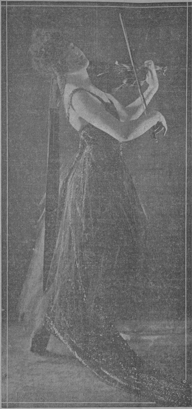
La baronesa Norka Rouskaya, famosa violinista y danzarina, una de las artistas más espirituales del baile, que actuará en el Capitolio, iniciando su temporada el día 16, en las tandas elegantes de las cinco y cuarto y de las nueve y media.

Norka Rouskaya, la más gentil de las grandes bailarinas actuales, hará su debut en el Teatro Capitolio el 16 del actual.