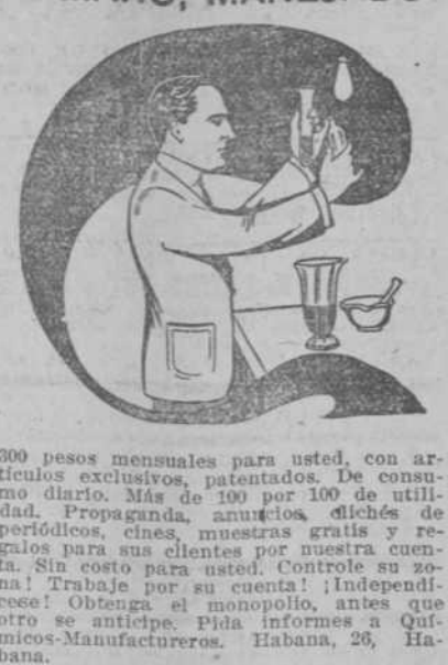
300 pesos mensuales para usted, con...