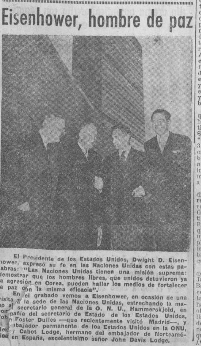
El Presidente de los Estados Unidos, Dwight D. Eisenhower, expresó su fe en las Naciones Unidas con estas palabras: "Las Naciones Unidas tienen una misión suprema: demostrar que los hombres libres, que unidos detuvieron ya la paz en Corea, pueden hallar los medios de fortalecerla".

Se trata de la vieja ermita de Puenteveñas, de la provincia de Segovia, que va destinada al Museo Metropolitano de Arte de Nueva York.