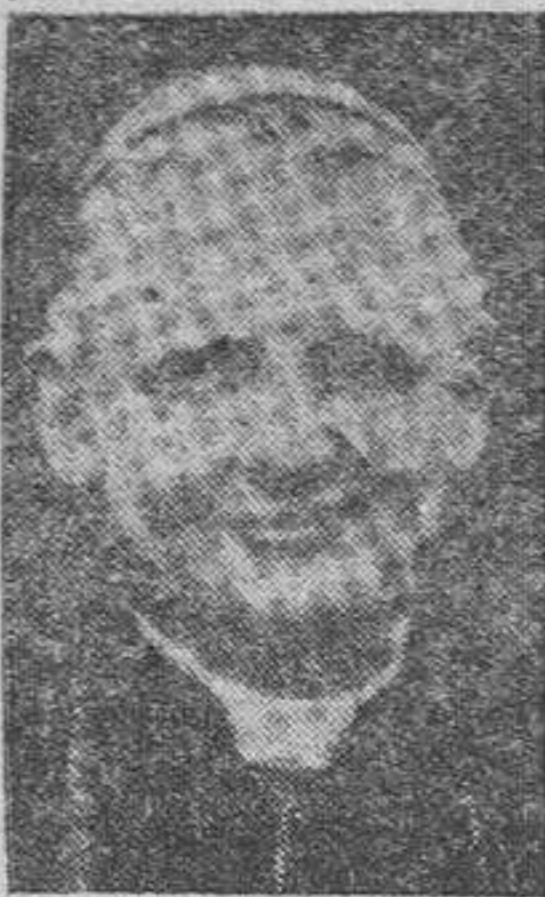
El cardenal Gerlier

Asistió a la junción Eucarística de la Universidad Civil y a un acto en la Pontificia Universidad Eclesiástica