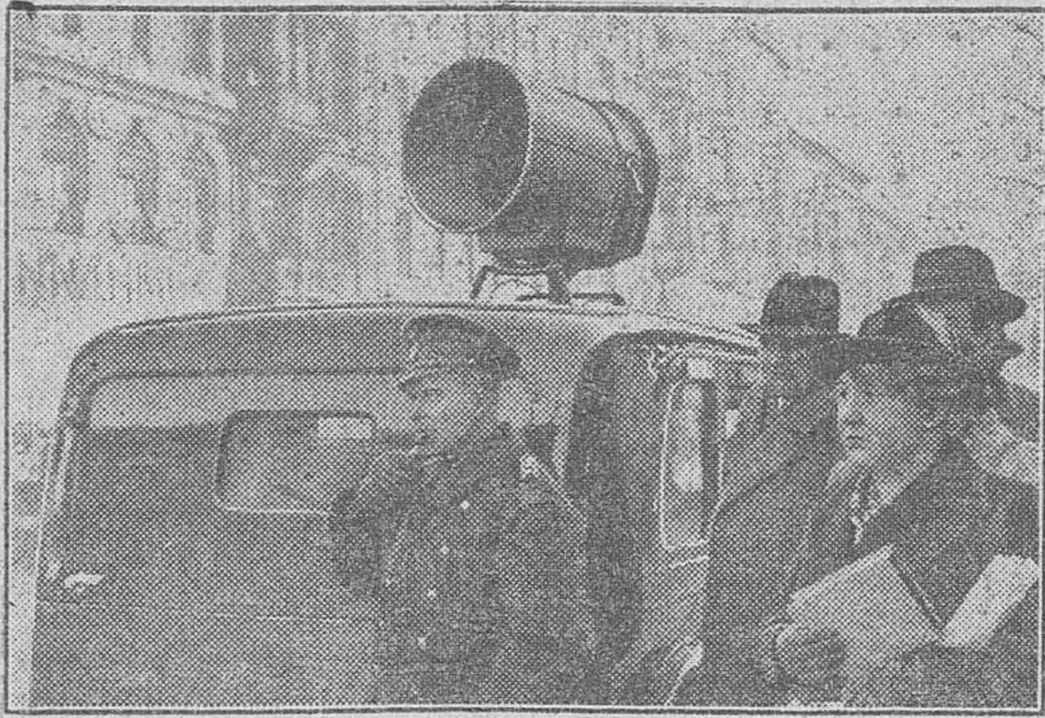
Auto de policía con altavoz.—Altavoz para disciplina de circulación. En Berlín la policía emplea en puntos de tráfico importantes vehículos con altavoz Telefunken, como medio de educación de los transeúntes.

violadores de la ley a los que se dirige la voz. Claro está que no se trata hoy del género de pecadores con los que tenía que enfrentarse el sereno. Estos modernos "pecadores del tráfico" son el producto del desarrollo de la motorización y del tráfico urbano cada vez más creciente.