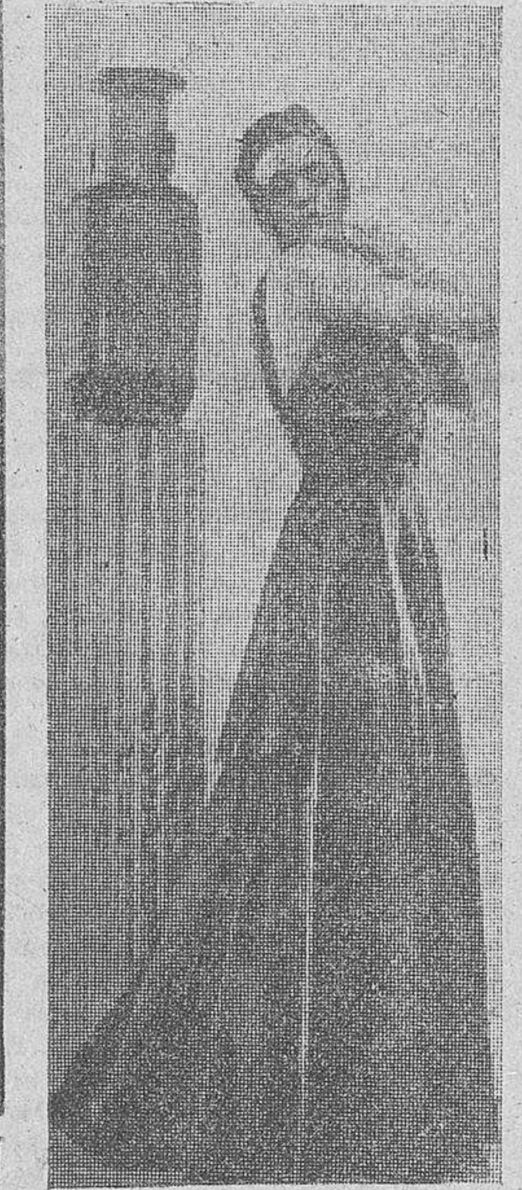
Un precioso modelo italiano de traje de noche

Para las mamás ¿Cómo vestiremos a nuestras hijas de trocas a catorce años? ¿Es ésta verdaderamente lo que pudiéramos