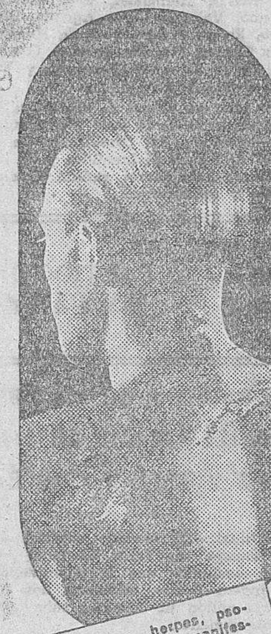
El eczema, herpes, psoriasis, etc., con manifestaciones de un sangrado viciado que se debe purificar con el DEPURATIVO RICHELET

El Depurativo Richelet, es más que nada el "rectificador" por excelencia de la sangre viciada, ya que bajo su acción la masa sanguínea se purifica completamente. La sangre vuelve a