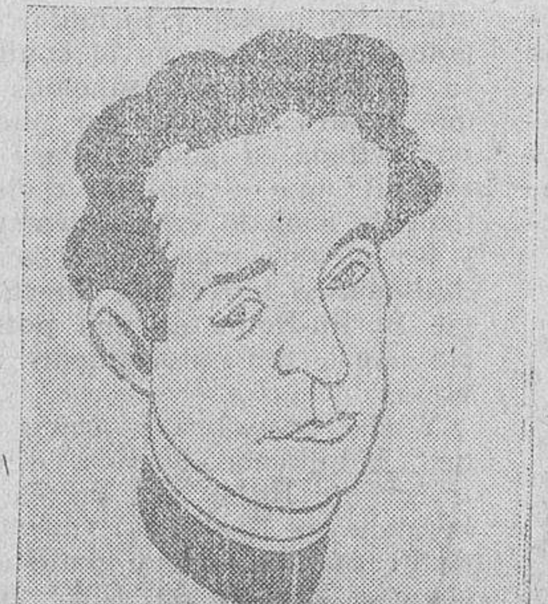
El rey Leopoldo de Bélgica