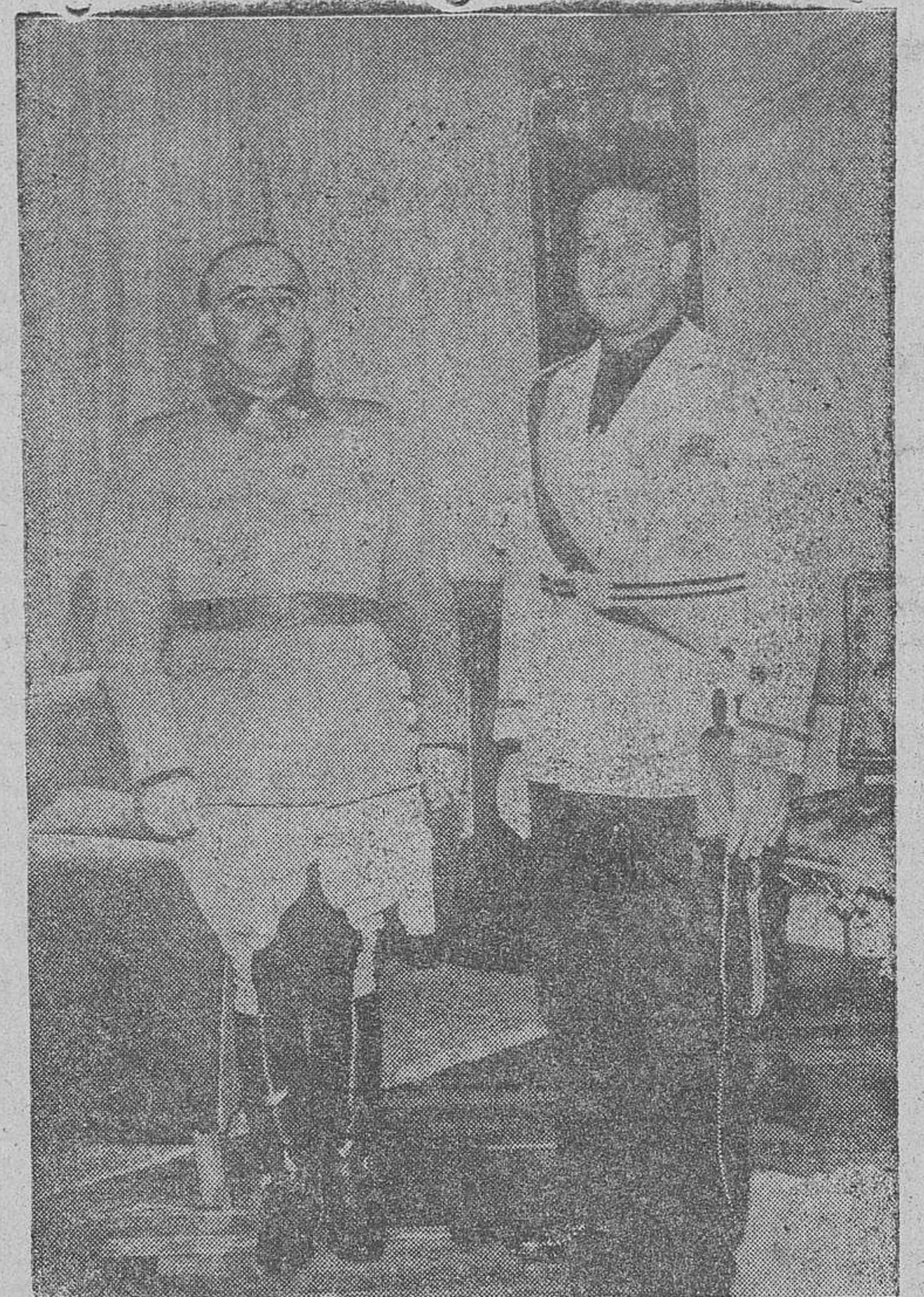
Su Excelencia el Generalísimo recibe por primera vez, en el palacio de Aytele, al ministro de Relaciones Exteriores de Italia, conde Galeazzo Ciano, celebrando a continuación una extensa entrevista

(Continúa esta información en tercera página).