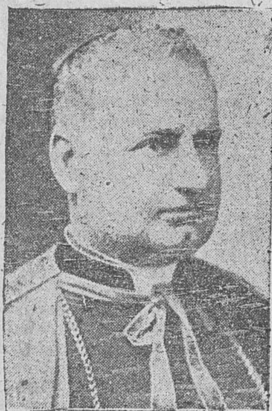
El cardenal Maglione, nuevo secretario de Estado del Vaticano

El cardenal Maglione ha sido nombrado Secretario de Estado del Vaticano :::::