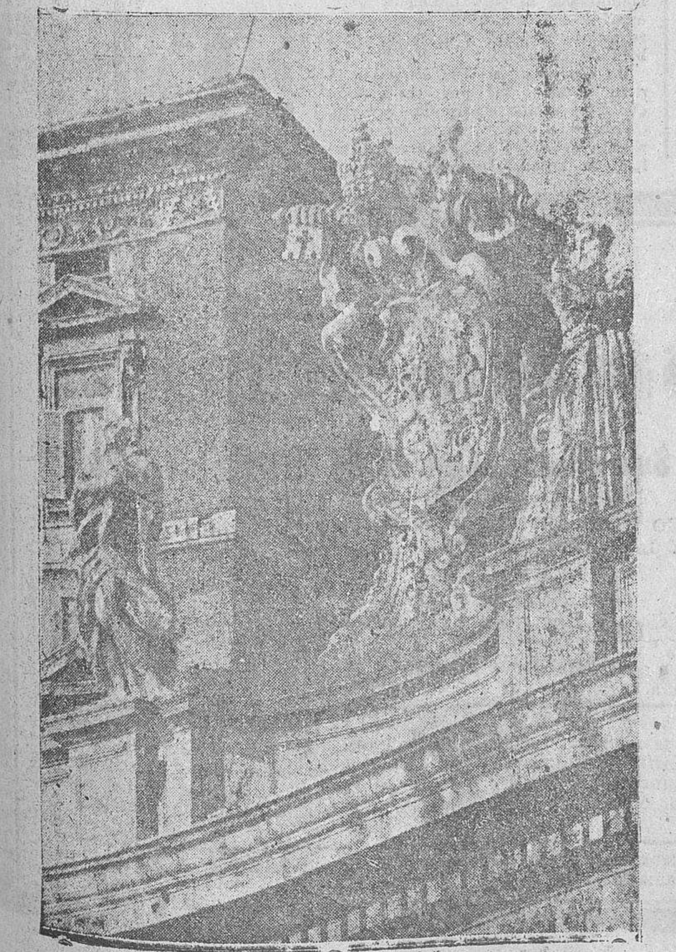
Ventanas de la habitación donde falleció el Papa Pío XI

París. — El periódico "Le Matin" escribe: "Según informaciones de fuente fidedigna, Mussolini ha decidido pronunciar un discurso político con ocasión de su visita oficial a Turin el domingo próximo. Parece que hay que esperar para el domingo una toma de posición del Duce, que se da por descontada desde hace muchos meses." (D.N.B.)