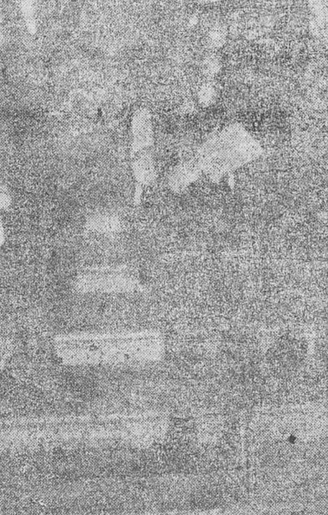
Un emocionante momento del entierro del Papa. El cortejo fúnebre desfiló por la Capilla Sixtina para dirigirse a la Basílica de San Pedro

Allí, después del canto "In Paradisum", el cadáver de Pío XI fué colocado en un ataúd, cubierto el rostro con un velo blanco. Un prelado co-