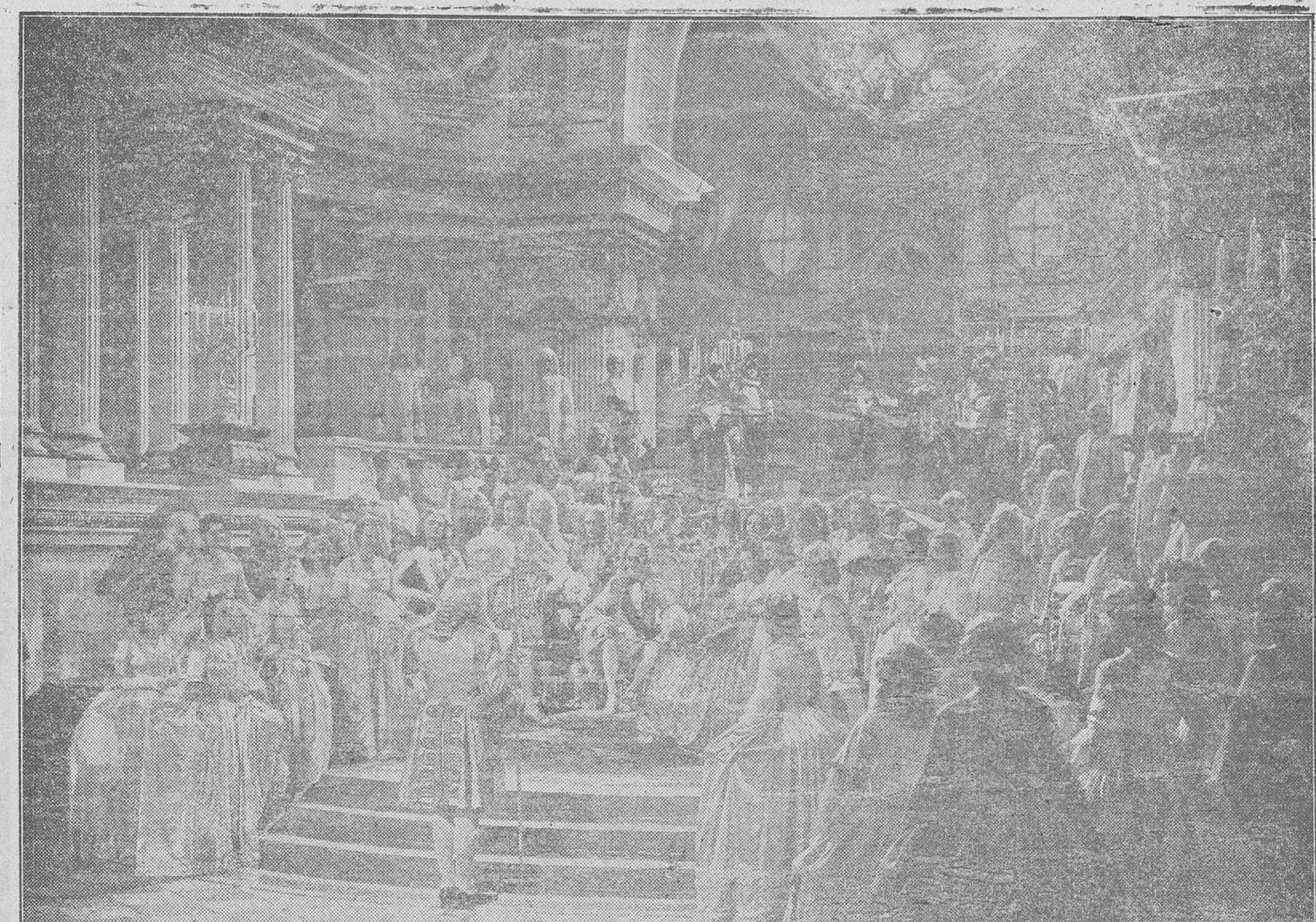
Fastuosa escena de una de las últimas películas alemanas de la UFA

Olga Tschechova para una Navidad en San Petersburgo. La más deliciosa de las "estrellas" podría habernos hablado de París.