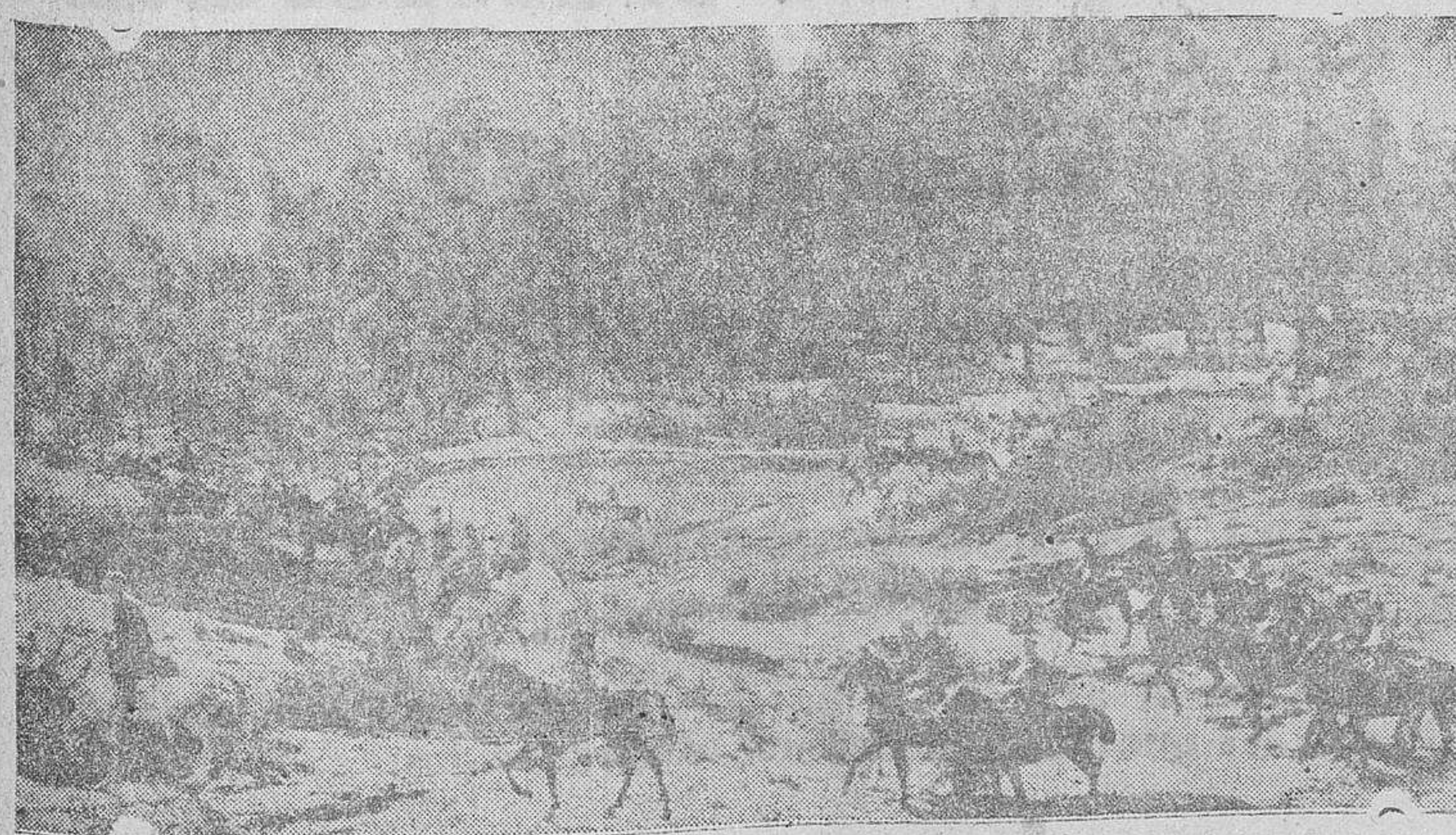
Una sección de la gloriosa Caballería nacional que tan brillante actuación ha tenido en las operaciones de limpieza de la extensa zona conquistada durante los últimos días

Ahora si que es aleccionador el vocerío de las radios marxistas! Llamamientos, proclamas, consignas ruidosas, amenazas terribles, lloviznas de falsas, sin excusas de edad ni justificación de oficios.