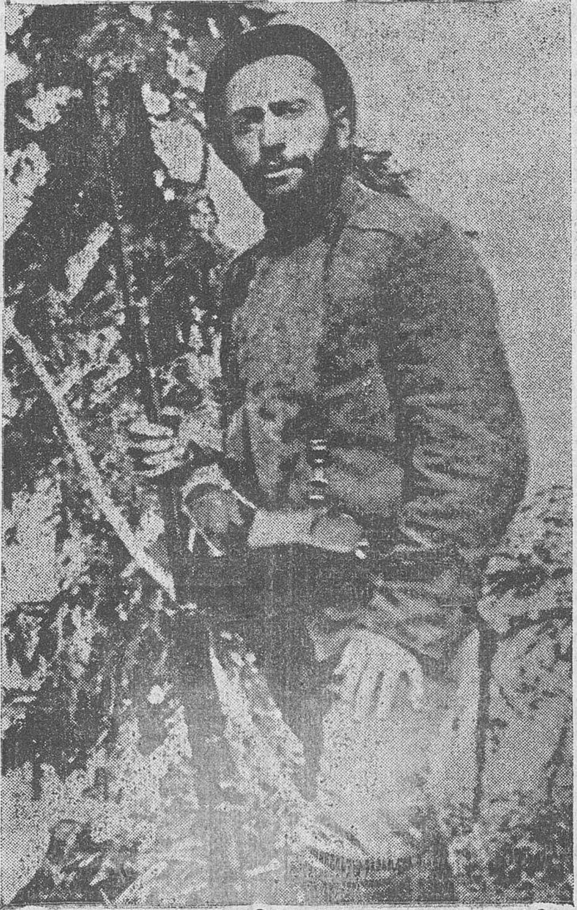
EL DUCE, COMBATIENTE

Y mientras un nuevo día alboraba en el horizonte político de Italia, en el número 9 de la Plaza de San Sepulcro, de Milán, en el "Círculo de los Intereses Industriales y Comerciales", reuníanse el 23 de Marzo de 1919,