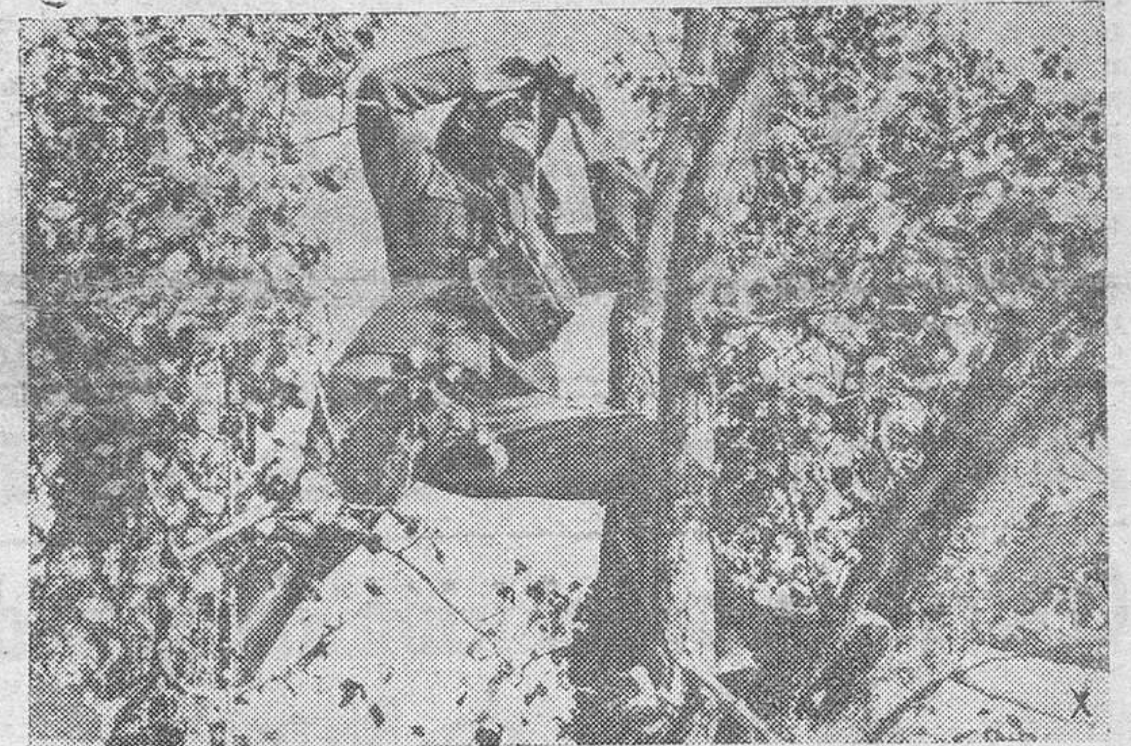
Desde lo alto de la copa de un árbol, el observador rumano otea el campo enemigo y comprueba los efectos de la artillería del Eje